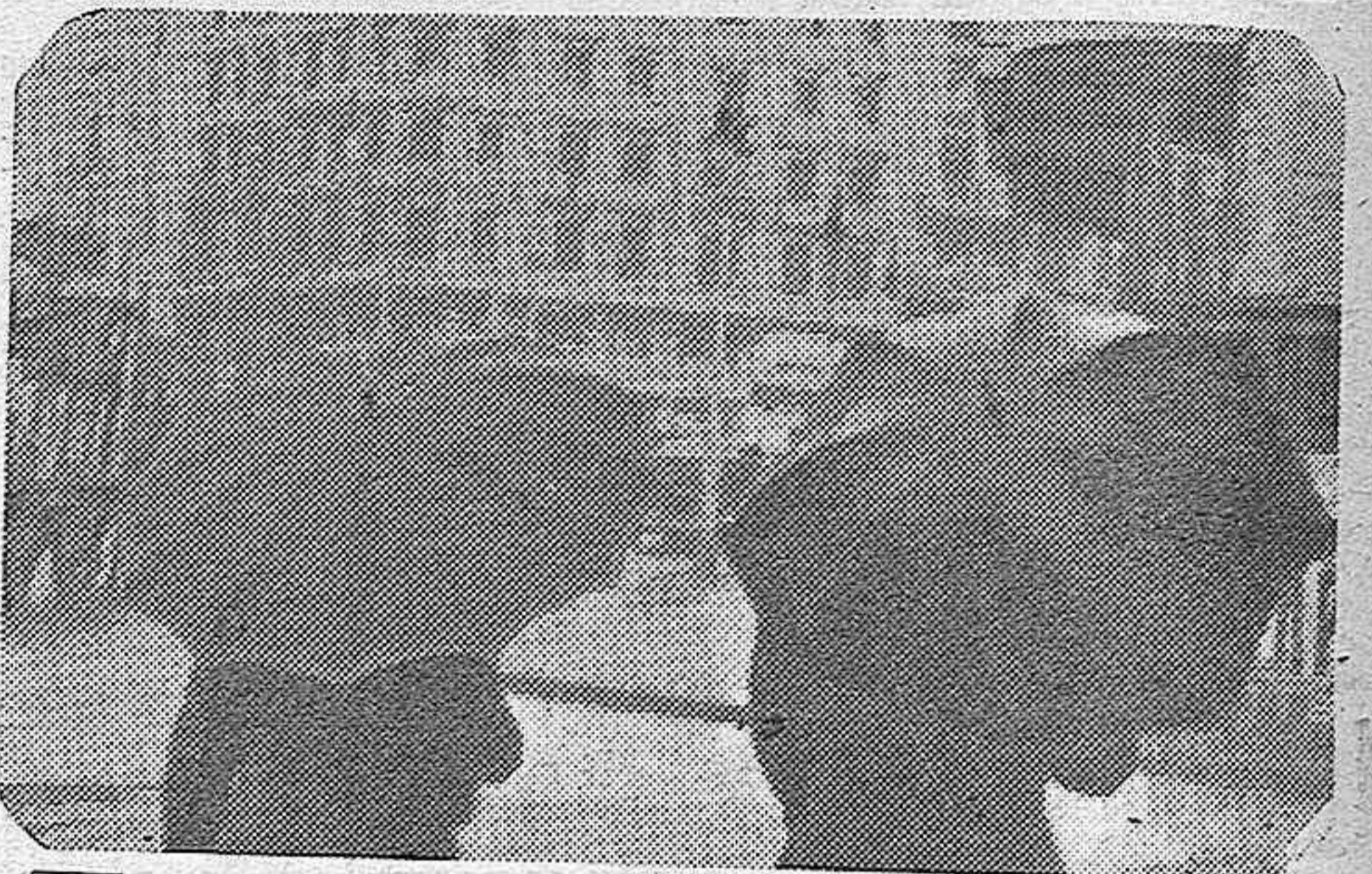
En estos días de calor grande en el centro de la urbe madrileña, un «chubasco» a tiempo viene a llenar de regocijo a los habitantes de la villa del oso y del madroño. He aquí una fotografía en la que se ven, en primer término dos espléndidos paraguas, bajo los que se cobijan dos madrileños, que, por lo visto, no querían refrescarse con las saludables gotas con que la naturaleza las obsequia

Español: Zaragoza fué el baluarte que impidió el avance del enemigo y lo fué por guardar dentro de sus muros la imagen de la Virgen del Pilar, regalo de la Madre de Dios en su venida en carne mortal a España. Muestra a la Virgen tu gratitud contribuyendo a la suscripción abierta para conmemorar tan fausto suceso.