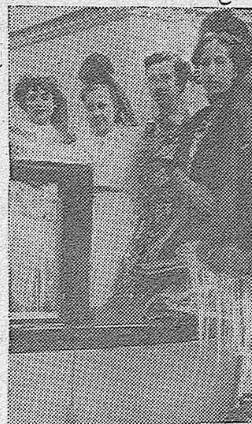
Señoritas que presidieron una de las becerradas celebrada en Madrid hace unos días