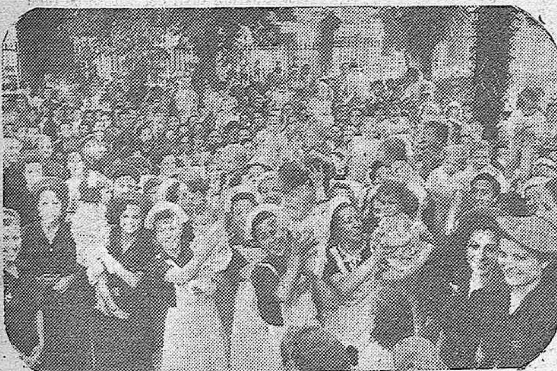
Cofias blancas y carnes en rosa tierna. Es menos frecuente este conglomerado bajo el epigrafe en cursiva de «Auxilio Social». Un día son comedores, otros refugios, y muchos como hace unos días, los primeros sollozos de los niños recogidos por estas madrinan, que les llevan, además del amor y el cuidado, las salutariferas aguas del bautismo