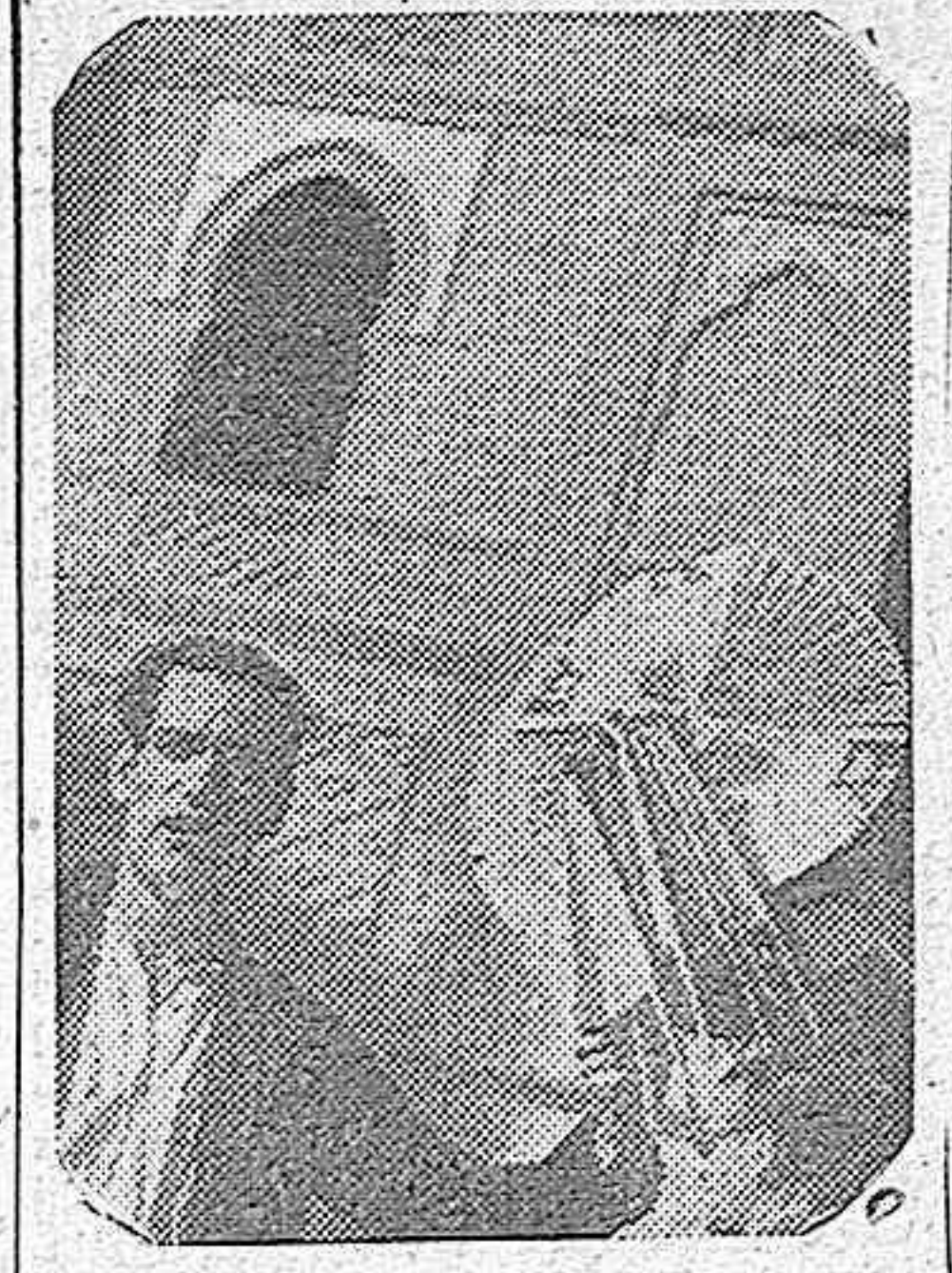
Frente a la plaza de toros pregona su mercancía, en las tardes de corrida, este vendedor de abanicos, que es tal vez el único madrileño que no ha reñido con el sol ni aun en estos días, en que tan gallardamente ha dado muestras de su poder.