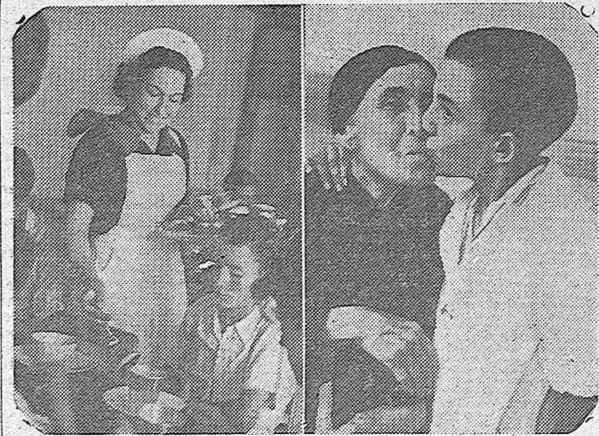
Los niños de los Colegios de la Paloma y de San Ildefonso han vuelto a Madrid, de donde los rojos los habían echado. En las fotografías, un grupo de ellos durante el desayuno que les fué servido por las afiliadas a Auxilio Social, y una escena, mil veces repetida desde la liberación de la que fué zona roja ese primer beso del niño que encuentra a sus familiares.