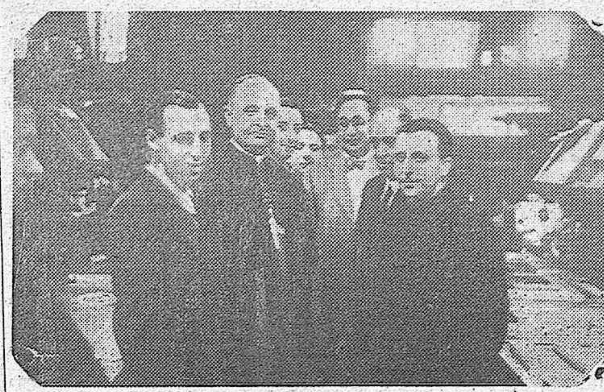
El ilustrísimo señor Obispo Auxiliar de París, monseñor Beausart, fotografiado en los talleres de nuestro querido colega madrileño "Yas", durante la visita que hizo a aquella C. isa.

Hay que devolver al Tesoro Nacional el oro que los marxistas nos robaron. Si tu niegas a la Patria tu aportación, ¿en qué te diferencias de ellos?