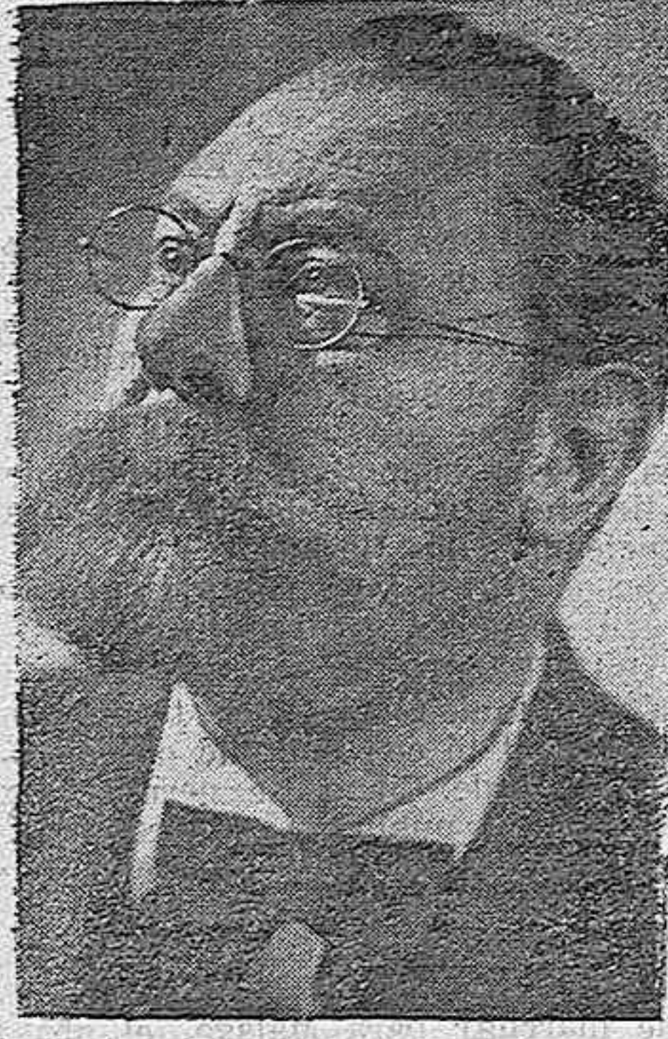
EMIL JANNINGS, que protagoniza el papel de "ROBERTO KOCH", en su notable caracterización

En los estudios de TOBIS, el rodaje de la película de gran realizador Hans Steinhoff «Roberto Koch—el luchador contra la muerte—toca a su fin.