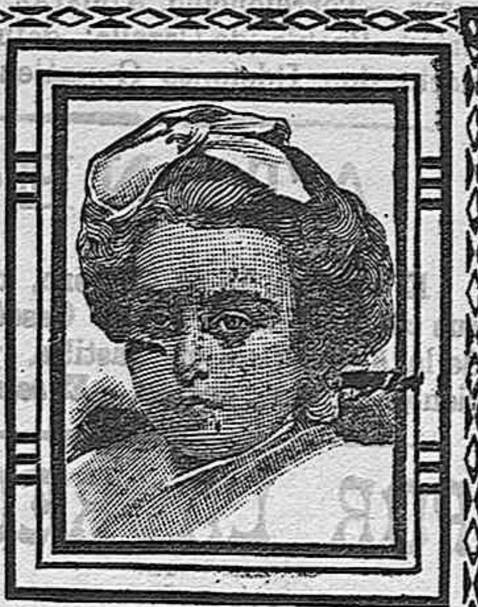
Barcelona, 11 Febrero 1908.

Aún no se sabe si concurrirá el señor Canalejas, el cual alega como principal argumento para asistir, el haber dado su palabra de hacerlo así, á varios amigos que lo solicitaron, y es seguro que si asiste, como parece cierto, el señor Canalejas, su discurso tendrá importancia y novedad.