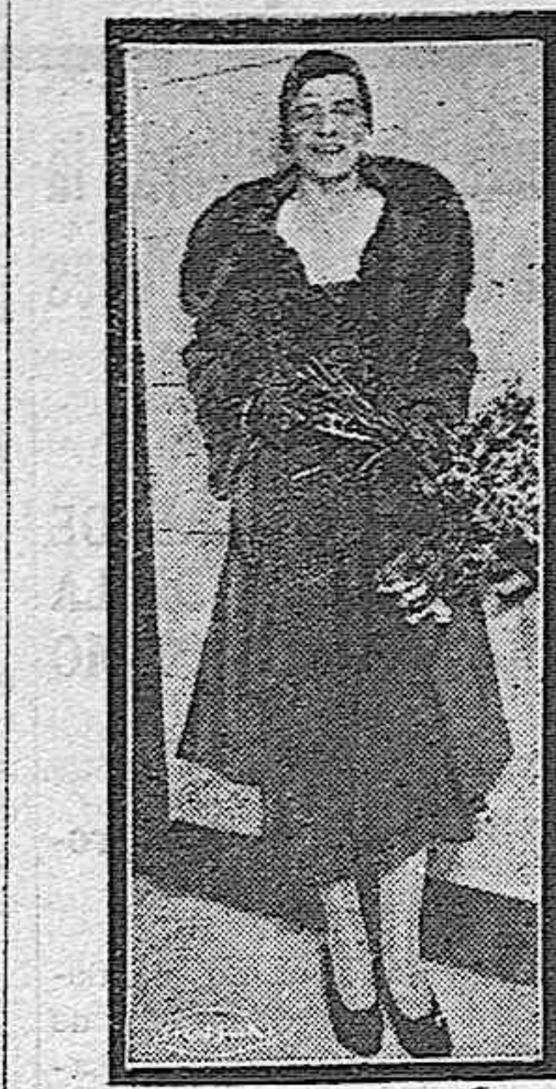
La aviadora alemana Elly Bihorn, cuyo paradero se ignoraba; pero que, según noticias posteriores, ha llegado sin novedad a Río de Oro...

La reina Adama—ex princesa Juana de Italia—, la princesa Eudoxia y el príncipe Cirilo, han tenido que guardar cama.