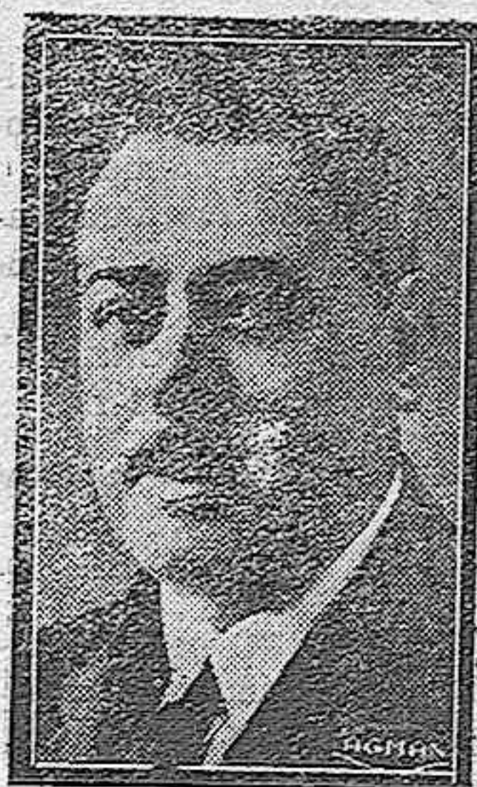
Enrique García Álvarez, el popularísimo autor festivo, figura relevante del teatro, que falleció en Madrid días pasados.