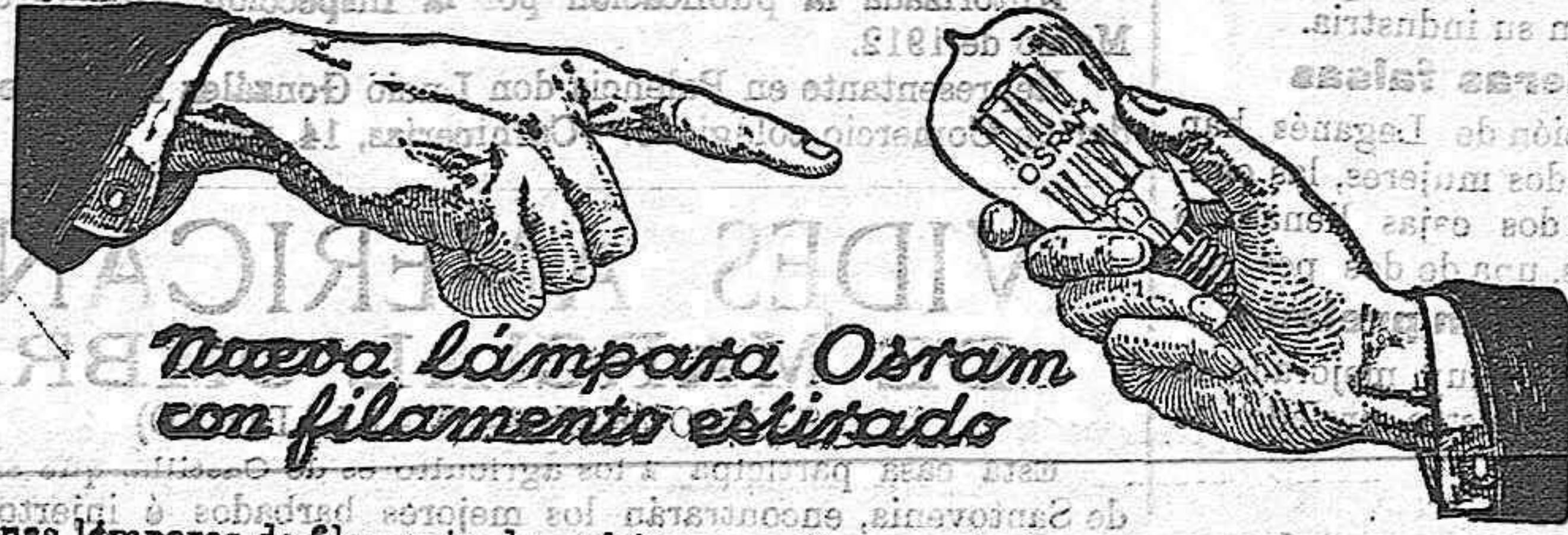
Nueva Lámpara Ostram con filamento estirado

Las antiguas lámparas de filamento de carbón ya no tiene razón de ser puesto que la OSRAM de filamento irrompible es tan resistente como aquellas y puede colocarse en cualquier instalación sin cuidado a roturas.