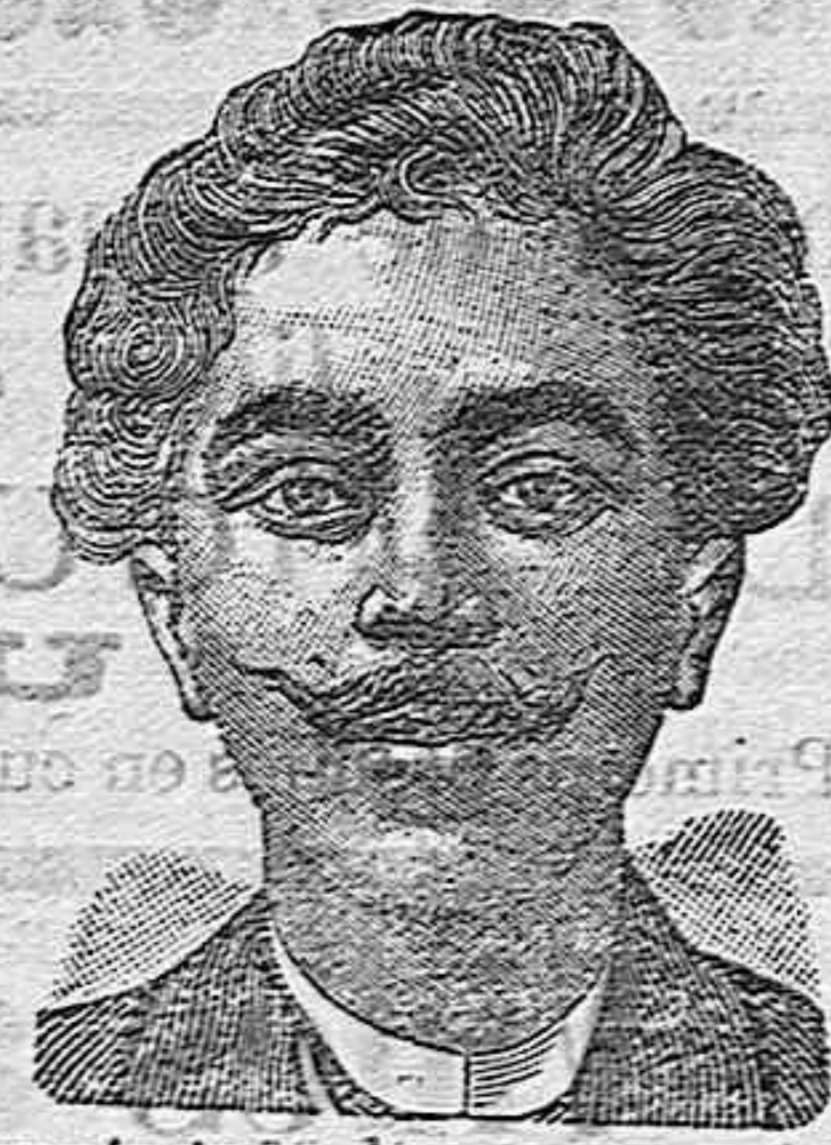
Después de 15 días de tratamiento