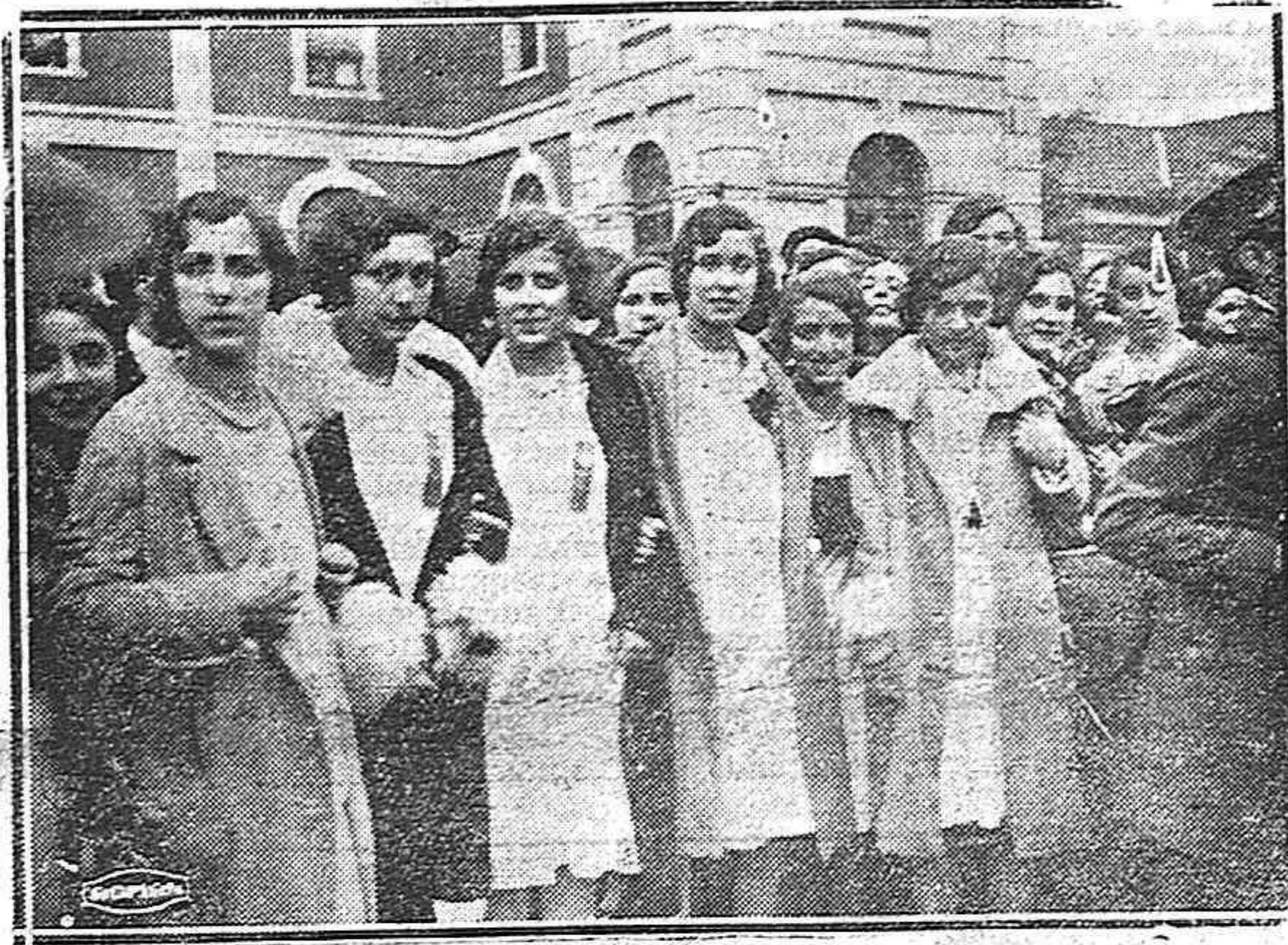
Simpatiquísimas orfeonistas burgalesas al poner pie en tierra palentina.

Turbia estuvo la alborada; turbias las primeras horas de la mañana desapacible; turbias las segundas horas... Lloverá? No lloverá...?