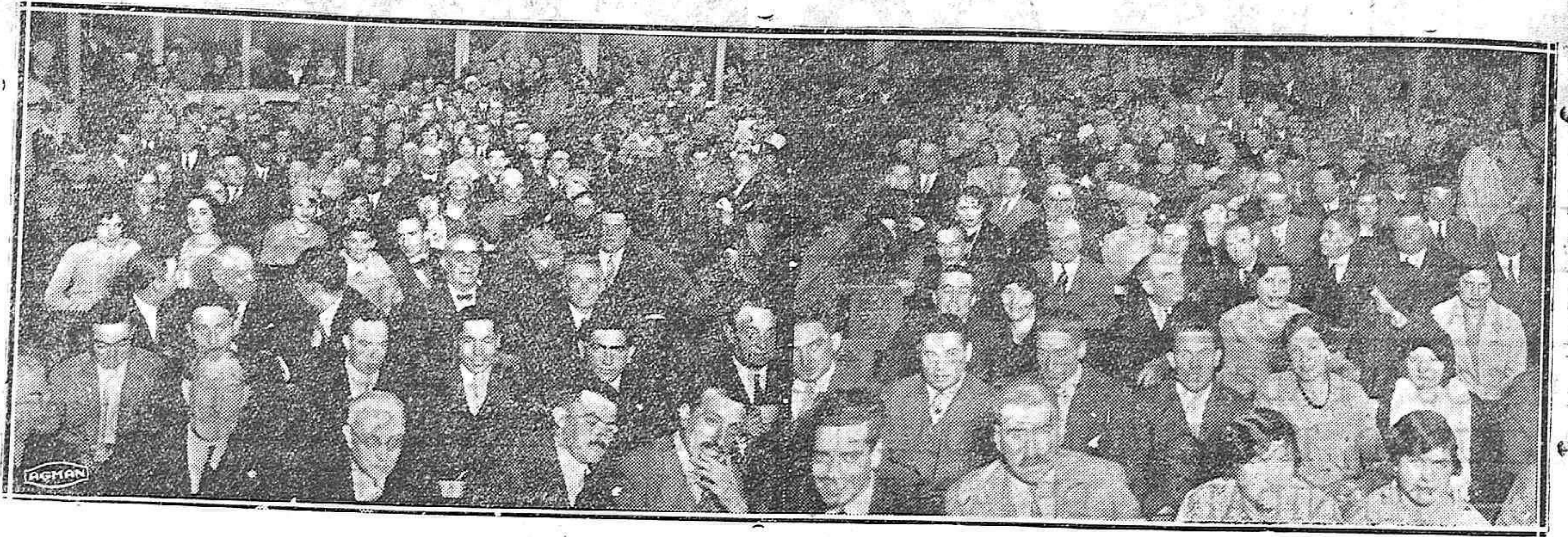
Aspecto de nuestro primer coliseo durante la actuación del Orfeón Burgalés.