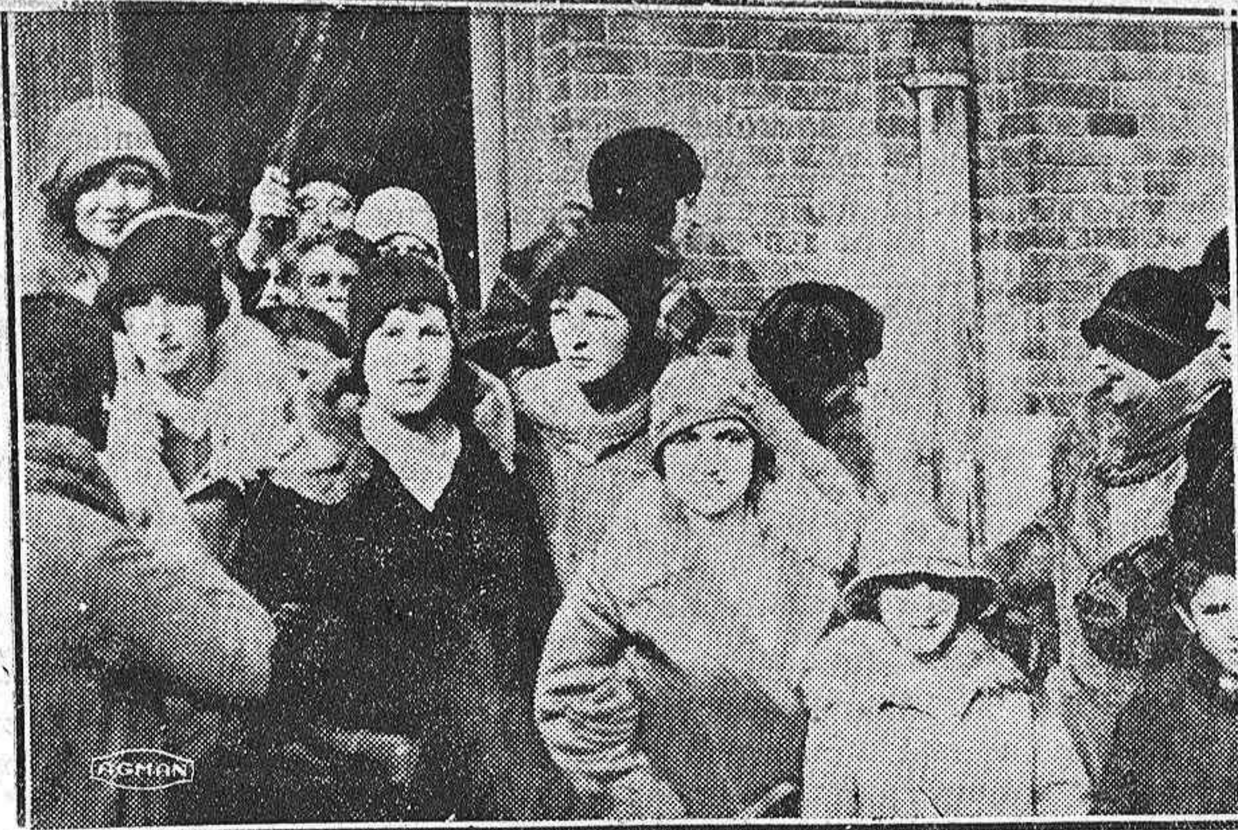
Un tropel de guapísimas muchachas de la Coral, al salir del Comedor Escolar.

Pero el pleito, no obstante, estaba así... Los documentos últimos hallados y esta crítica de ahora acometida en París, vienen ya a presentarlo de otro modo.