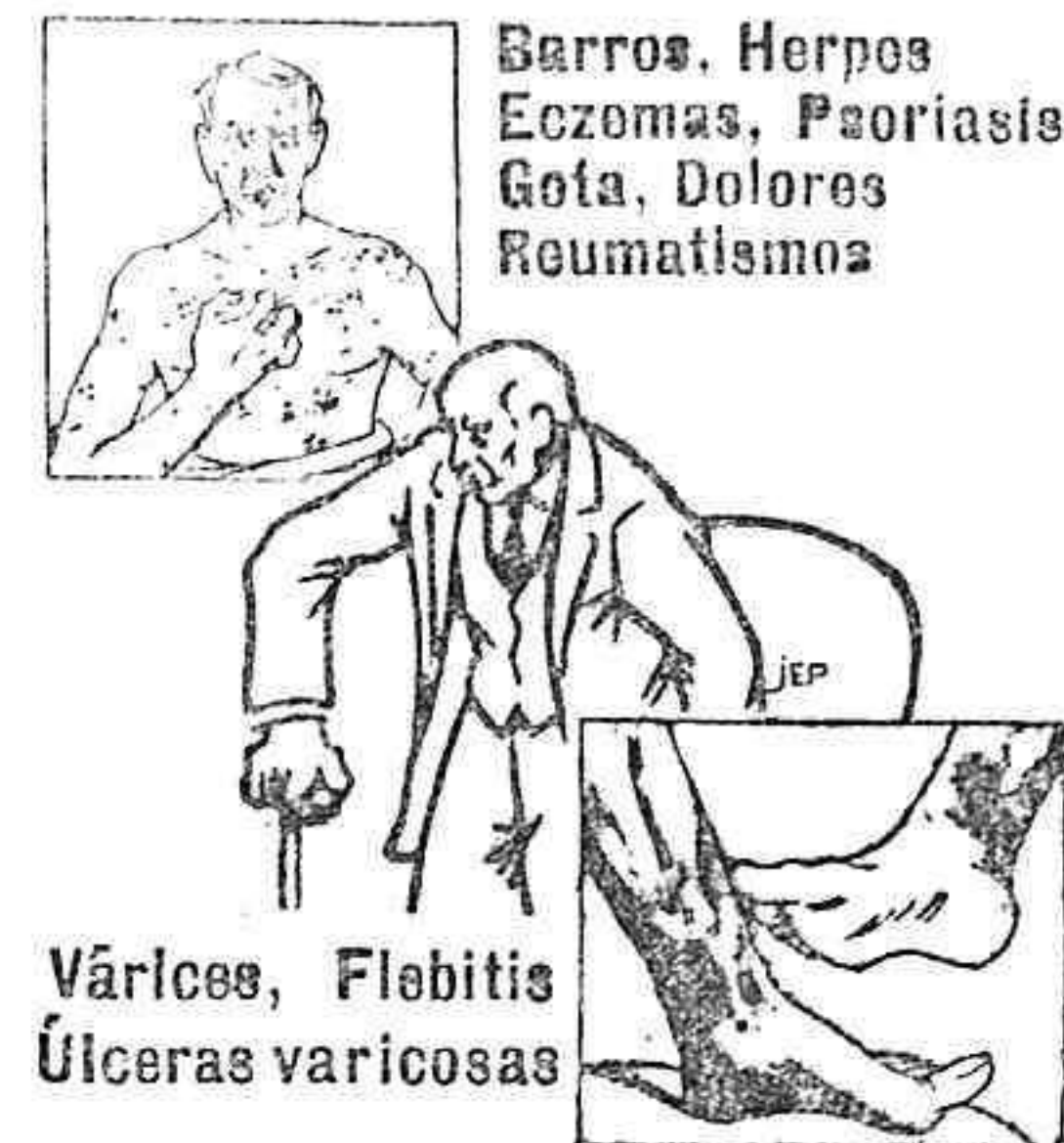
Barros. Herpos Eozomas, Psoriasis Gota, Dolores Reumatismo