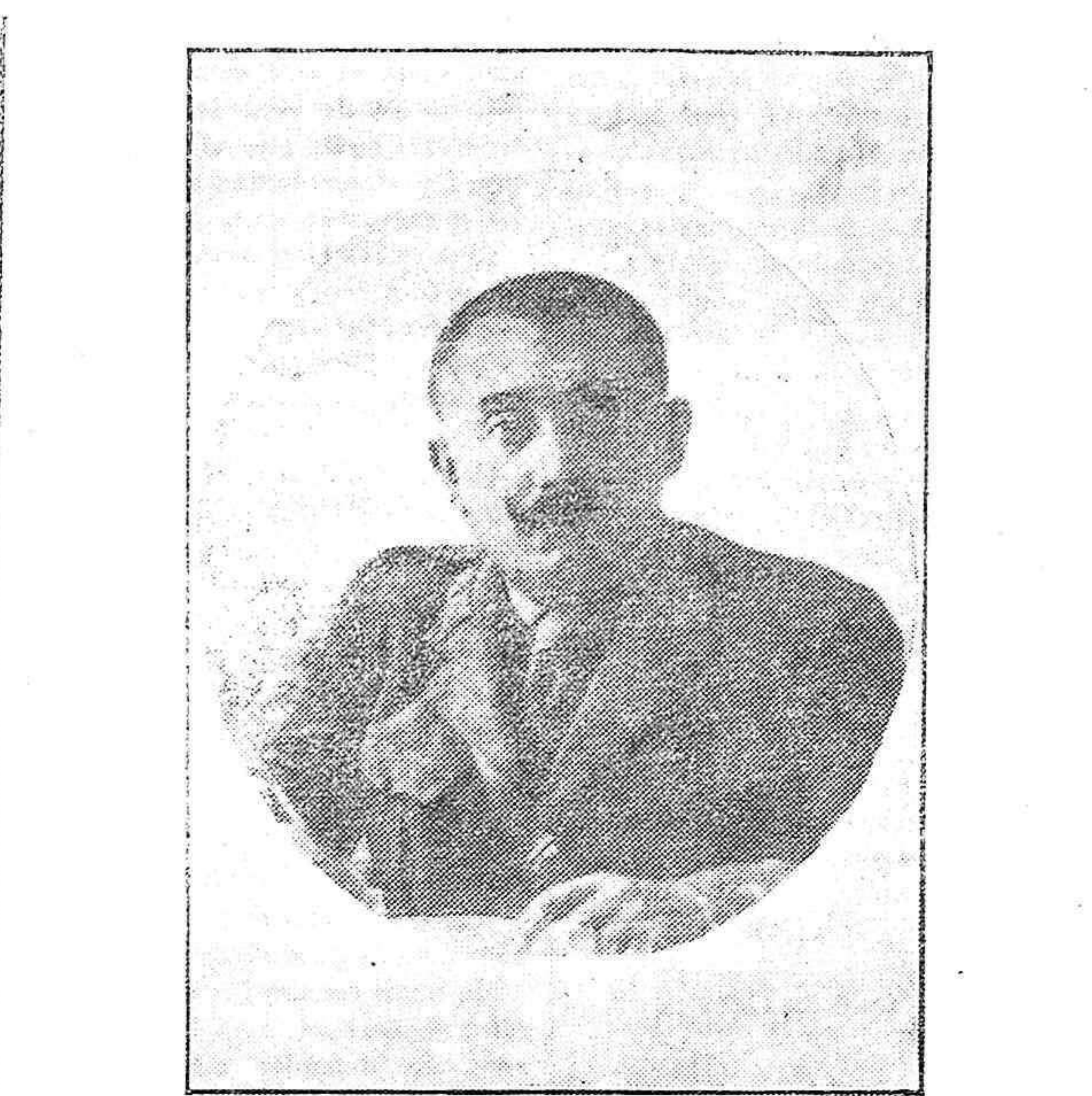
D. ALBERTO CASTRO GIRONA General de División recientemente ascendido por su heroico comportamiento en Marruecos.

El día 31, primera Pascua, fué honrado este pueblo, con la estancia durante breves horas, del bizarro y valiente militar. En ninguna otra