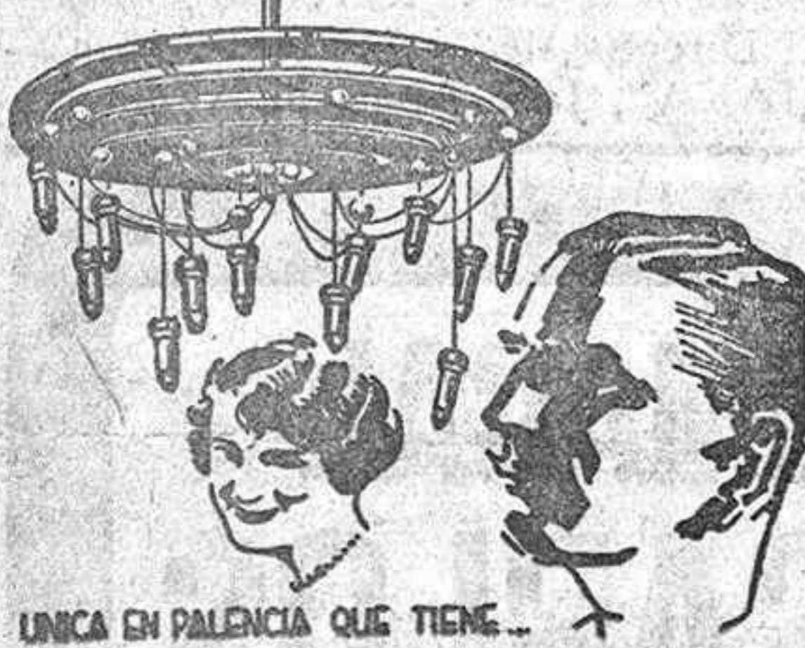
UNICA EN PALENCIA QUE TIENE...

LA HIGIENICA GRAN PELUQUERIA DE SEÑORAS Y CABALLEROS CASA SANTA CRUZ