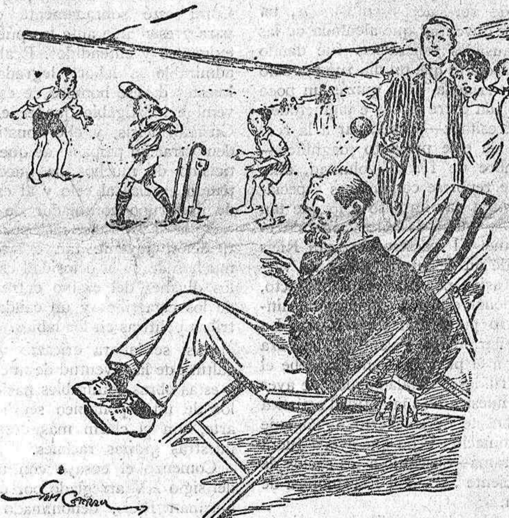
El buen señor, despertándose.—Perfectamente, querido, yo te lavaré los platos!