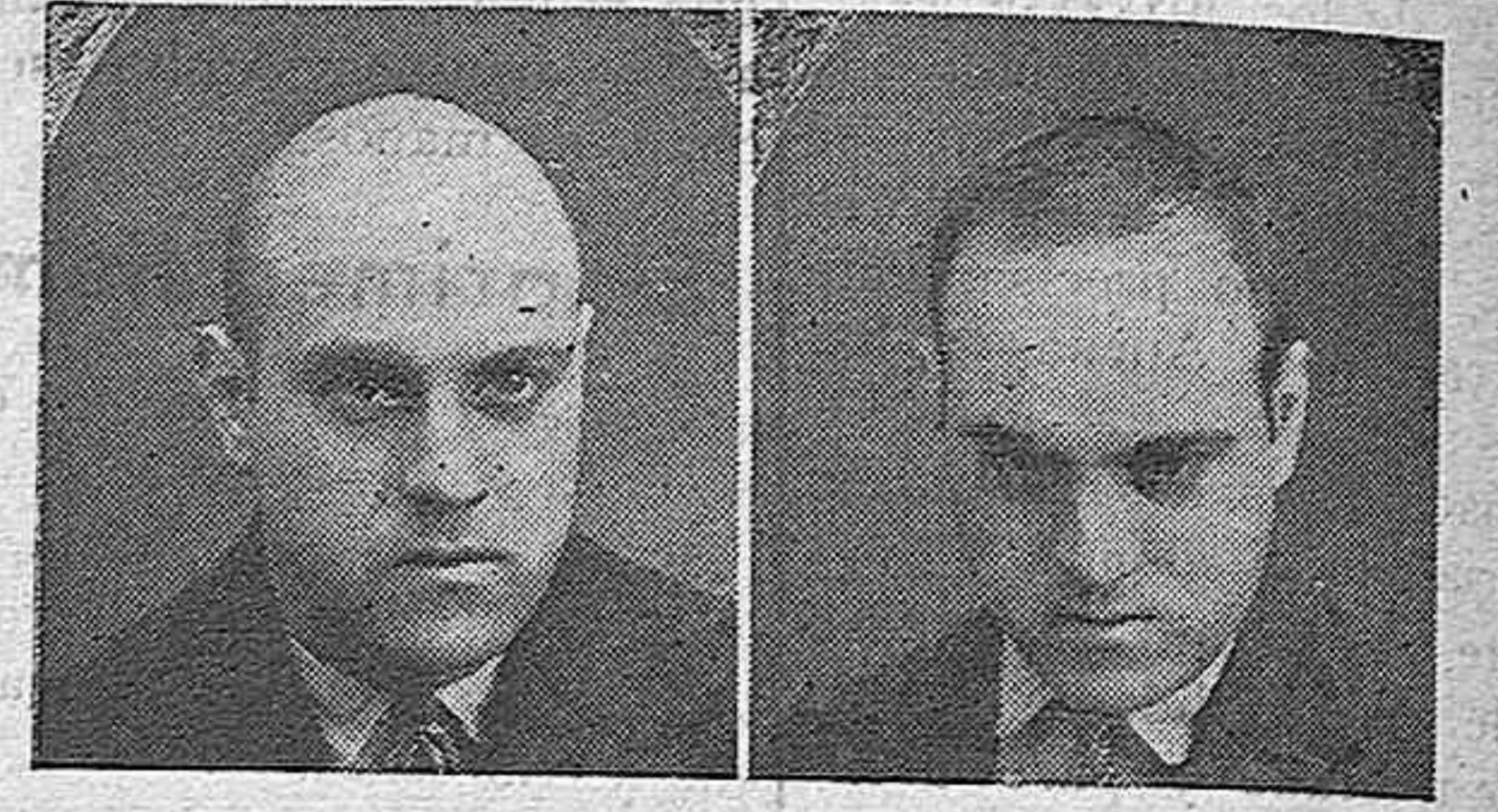
10 años calvo 10 meses de tratamiento

NOTA.—Los días 29, 30 y 1.º de Mayo, se encontrará en el Hotel París, de León.