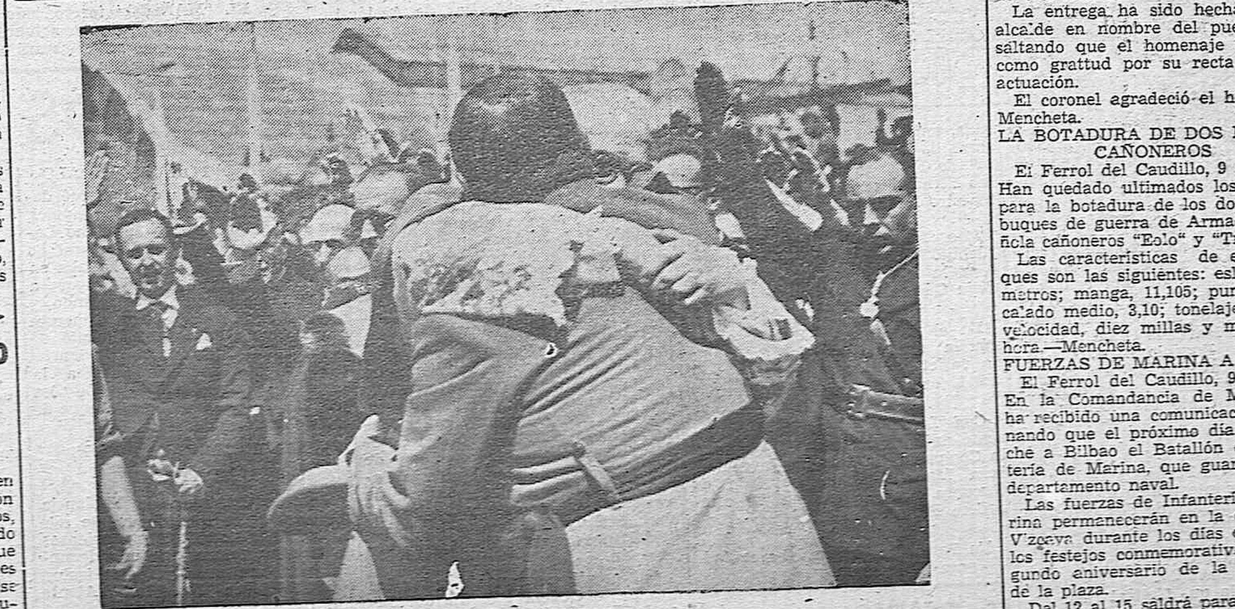
VIGO.—Momento en que el arzobispo de Valladolid abraza al general Aranda tras la imposición de las insignias de la Gran Cruz Laureada de San Fernando, que por él le fueron impuestas en el acto de homenaje al jefe del Cuerpo de Ejército de Galicia.