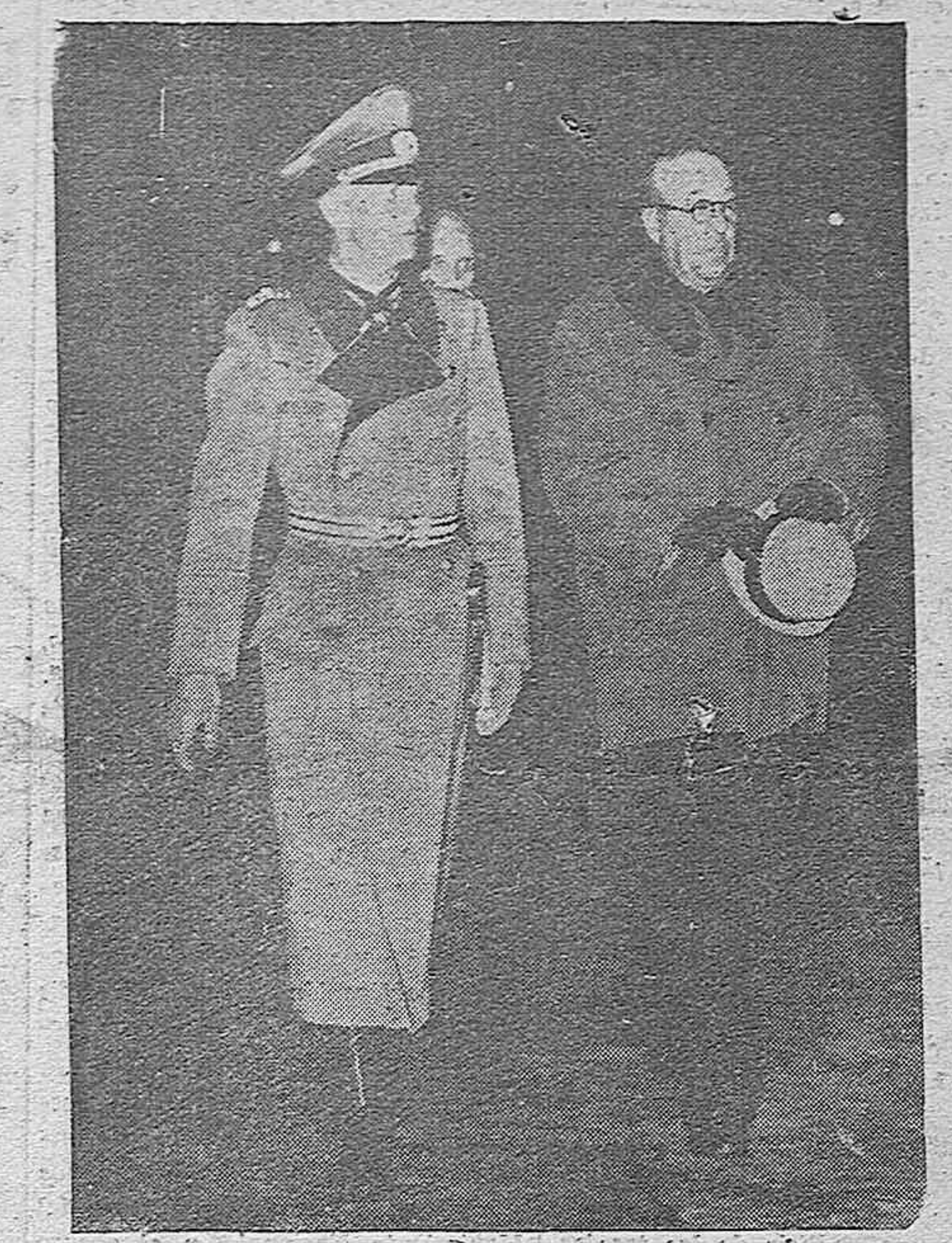
El presidente de la delegación española, general Moscardó, saliendo del aeródromo de Tempulhof en compañía del gobernador militar de Berlín, para tomar parte en las fiestas del 50 cumpleaños del Führer.