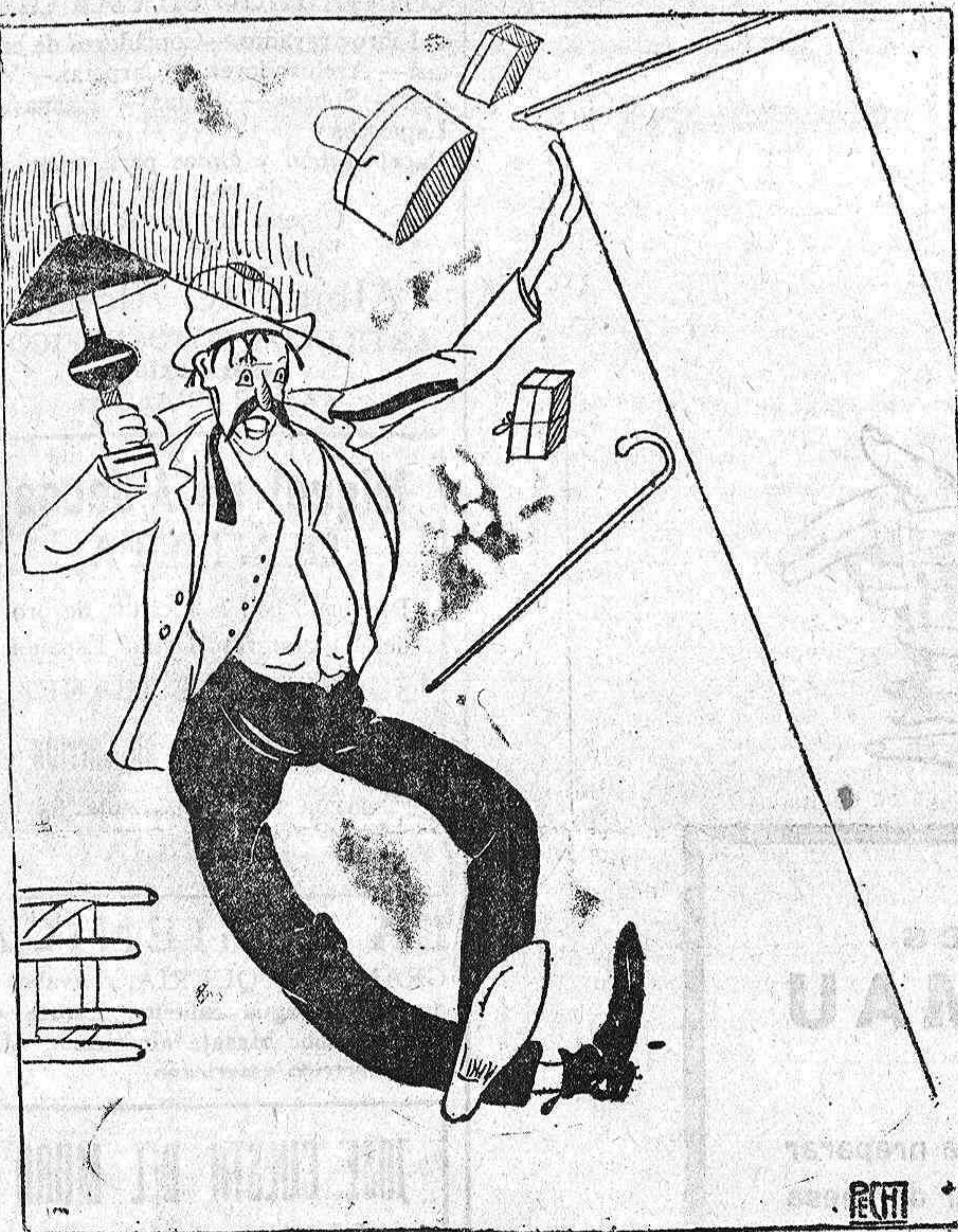
—Entraré muy despacio para que no se entere mi mujer a la hora que regreso...