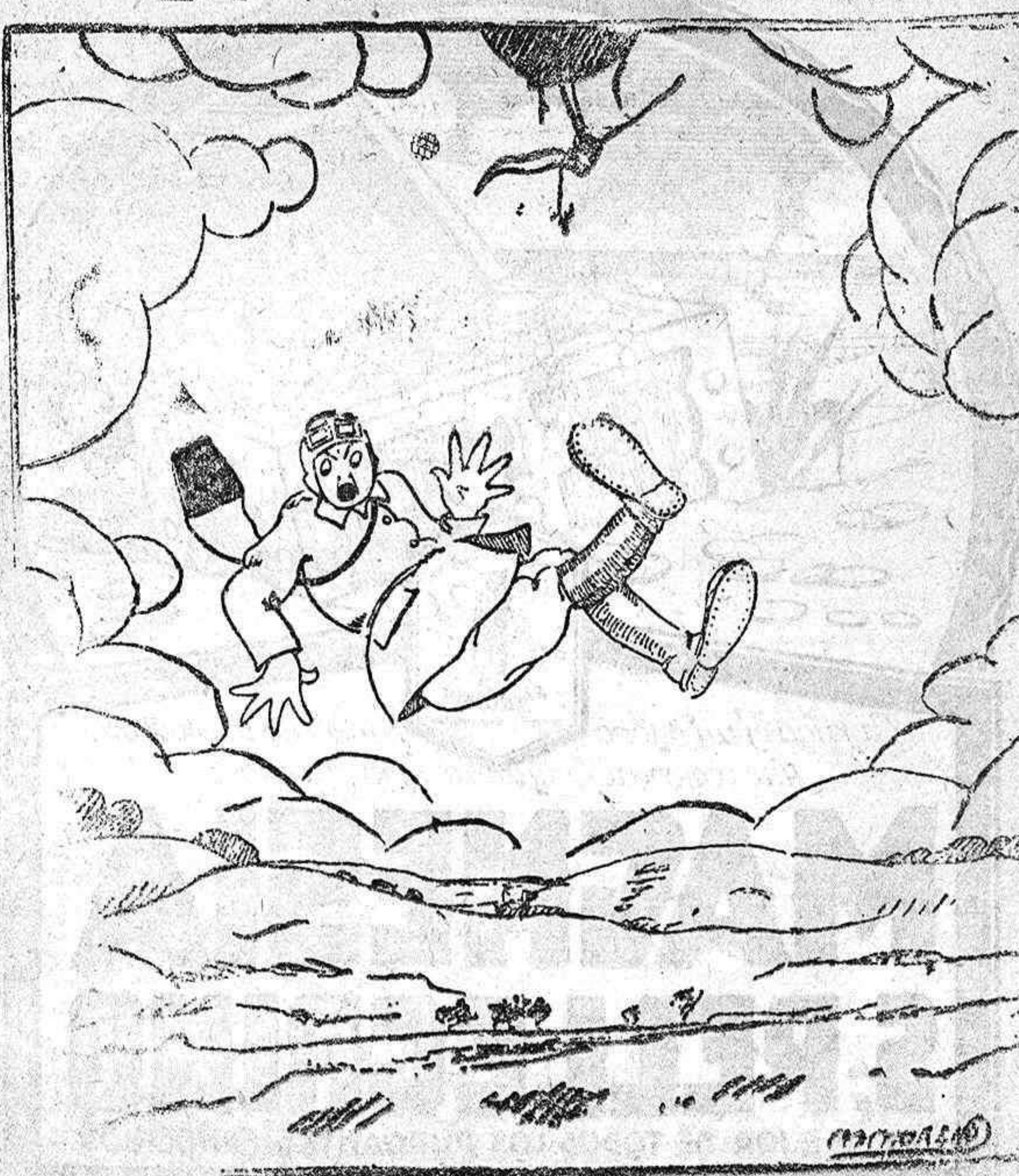
El aeronauta accidentado.—Si algo de euro es que me ama Lolita