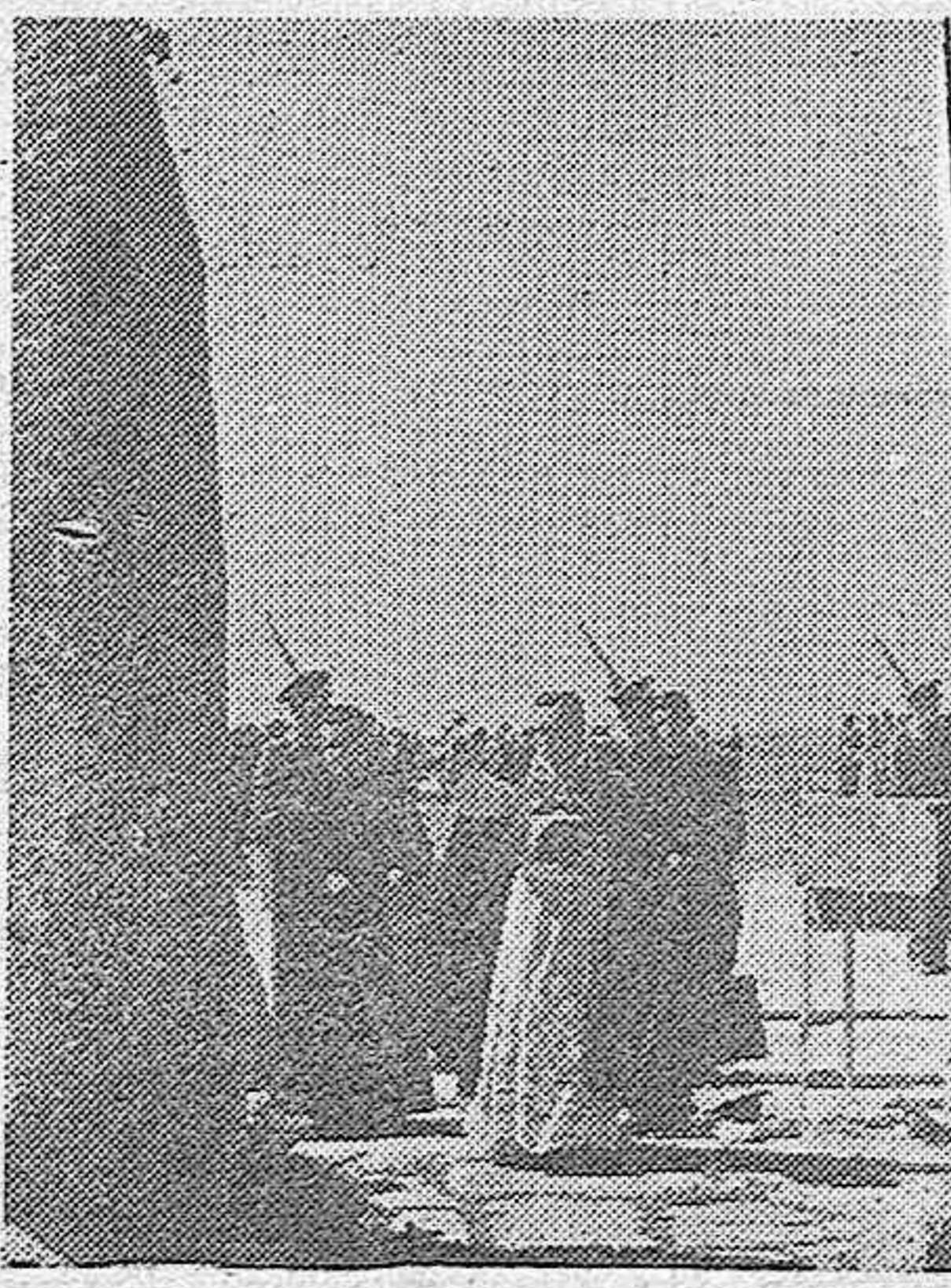
El capellán castrense reza un responso ante el monolito levantado en Griñón en el lugar en que cayó el laureado García Morato. Ya viuda y la madre del glorioso aviador, familias de otros heroicos pilotos caídos por España, y el desfile de los cadetes de Aviación durante la solemne ceremonia celebrada.