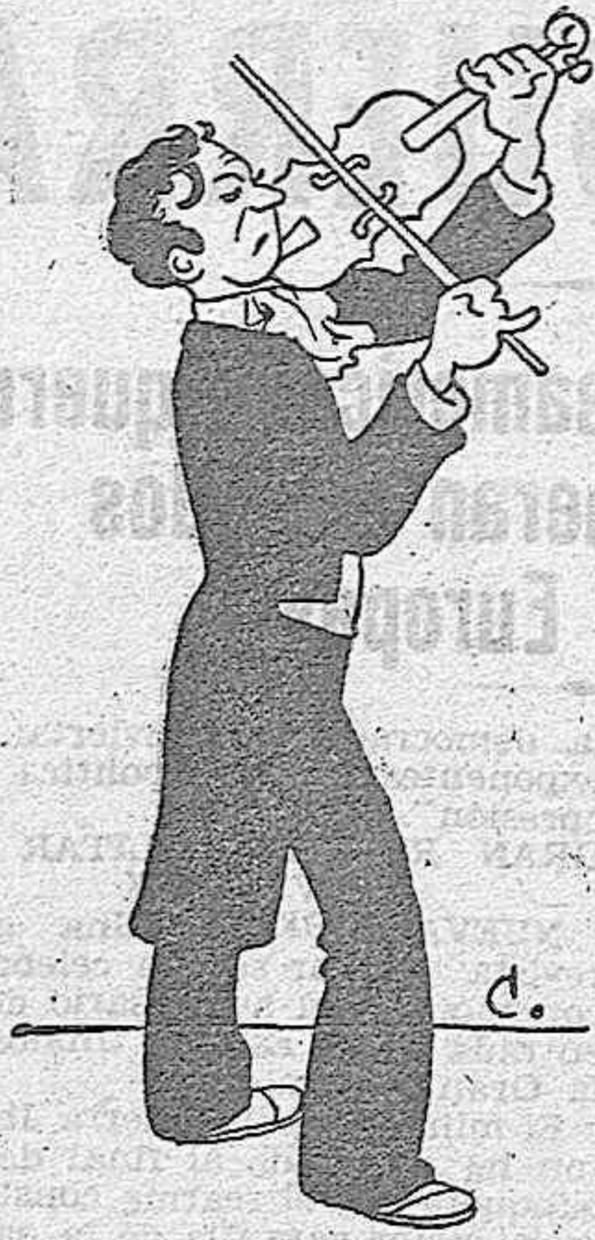
SOLER AGUILAR, EL MAGO DEL VIOLIN QUE ESTA TRIUNFANDO EN EUROPA