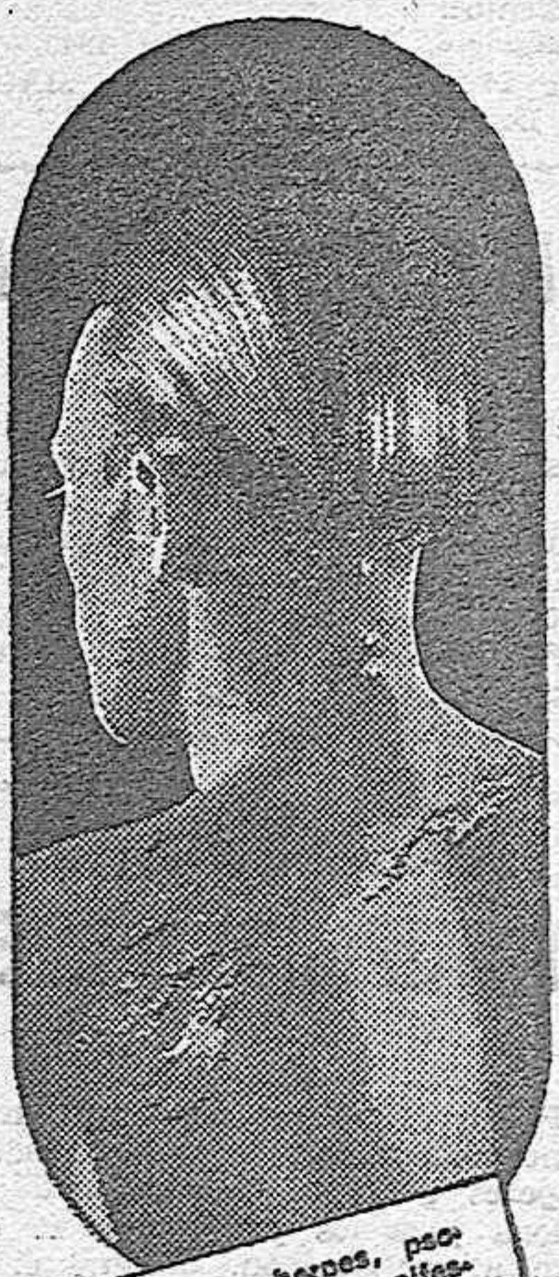
El eczema, herpes, psoriasis, etc., son manifestaciones de una sangre viciada que se debe purificar con el DEPURATIVO RICHELET

El Depurativo Richelet, es más que nada el "rectificador" por excelencia de la sangre viciada, ya que bajo su acción la masa sanguínea se purifica completamente. La sangre vuelve a