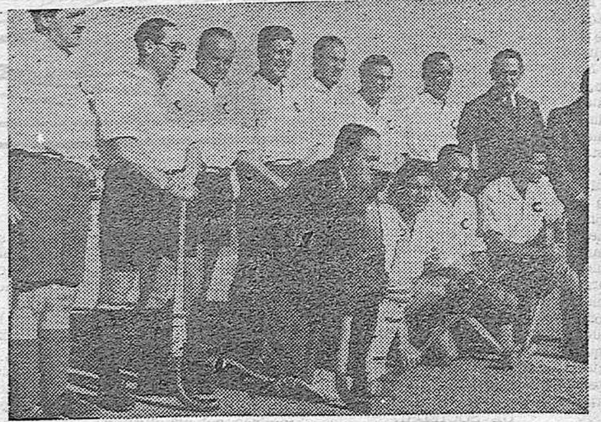
He aquí el equipo de hockey del Club del Campo, que viene realizando un intenso entrenamiento ante la proximidad de varios encuentros internacionales.