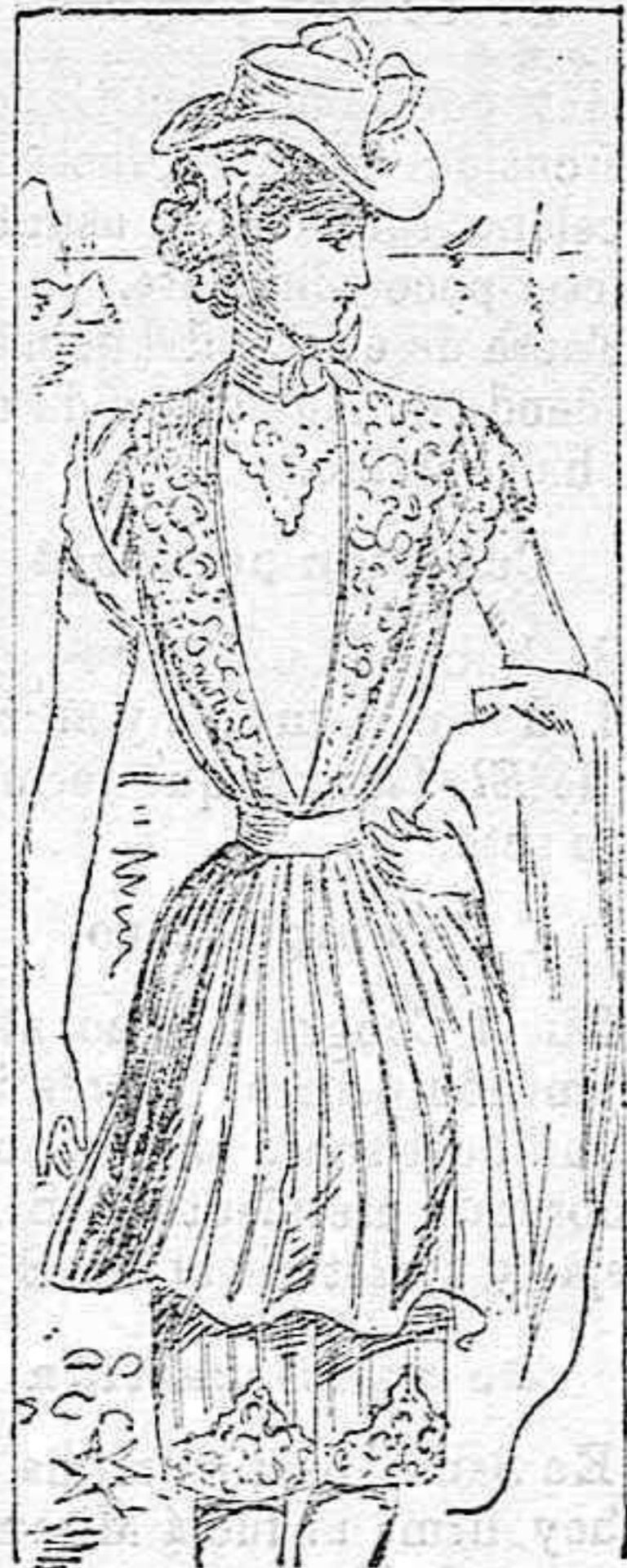
Traje para baño

Modelos exclusivos para nuestras lectoras, de los grandes almacenes de EL SIGLO, Barcelona.