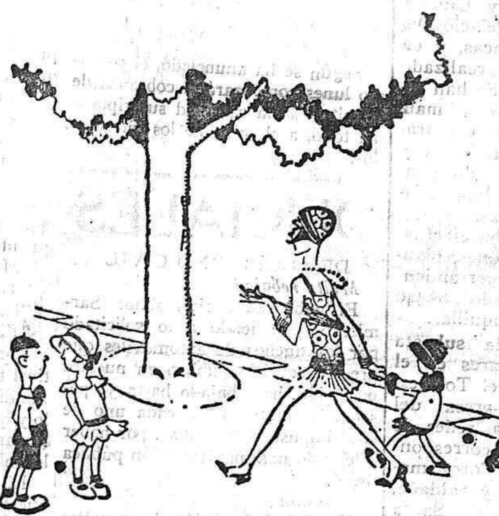
CONFUSIONES MODERNAS —Es su hermana mayor? —No, su abuela.

El periódico más ameno e interesante en EL DIARIO