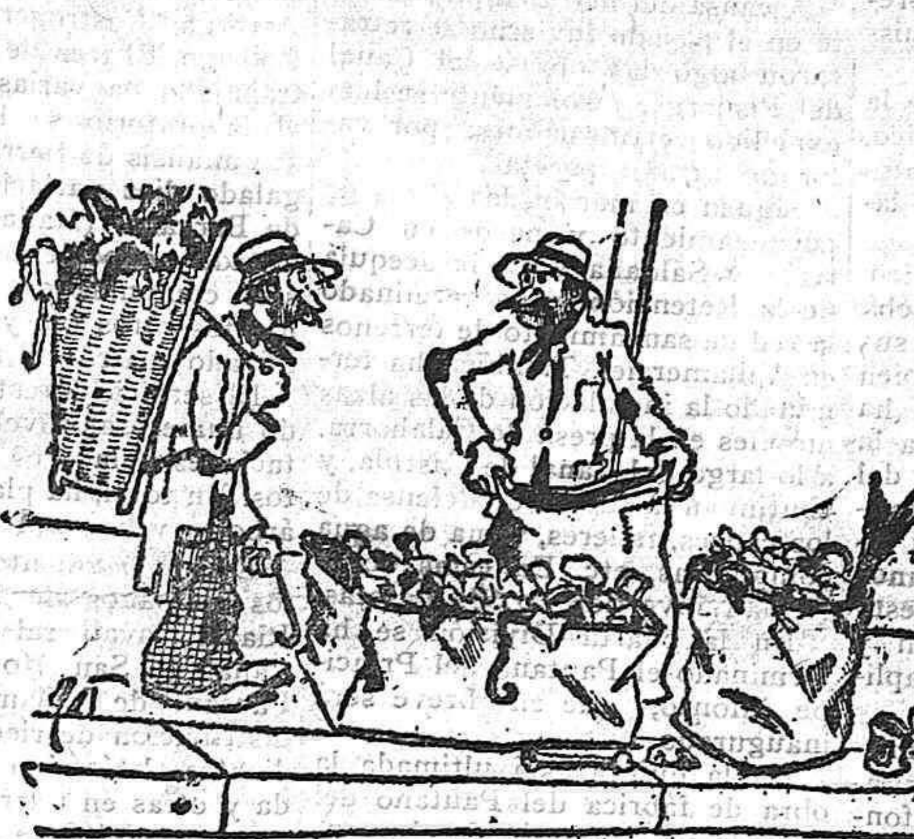
—Qué te parece! Mauricio se ha comido en quince días la dote que le trajo su mujer... —Qué bárbaro! Trescientos sacos de trapos y seis mil kilos de hierro viejo!