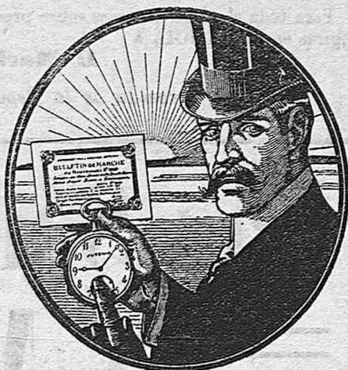
— Si, Señor, el reloj JUVENIA es el mejor!

La purga más agradable que se conoce es el AZUCAR DE VAINILLA PURGANTE de FUENTES MONTURIOL. Cada paquete con tres dosis vale 0,25 pesetas, en la Farmacia del DR. FUENTES, MAYOR, 114