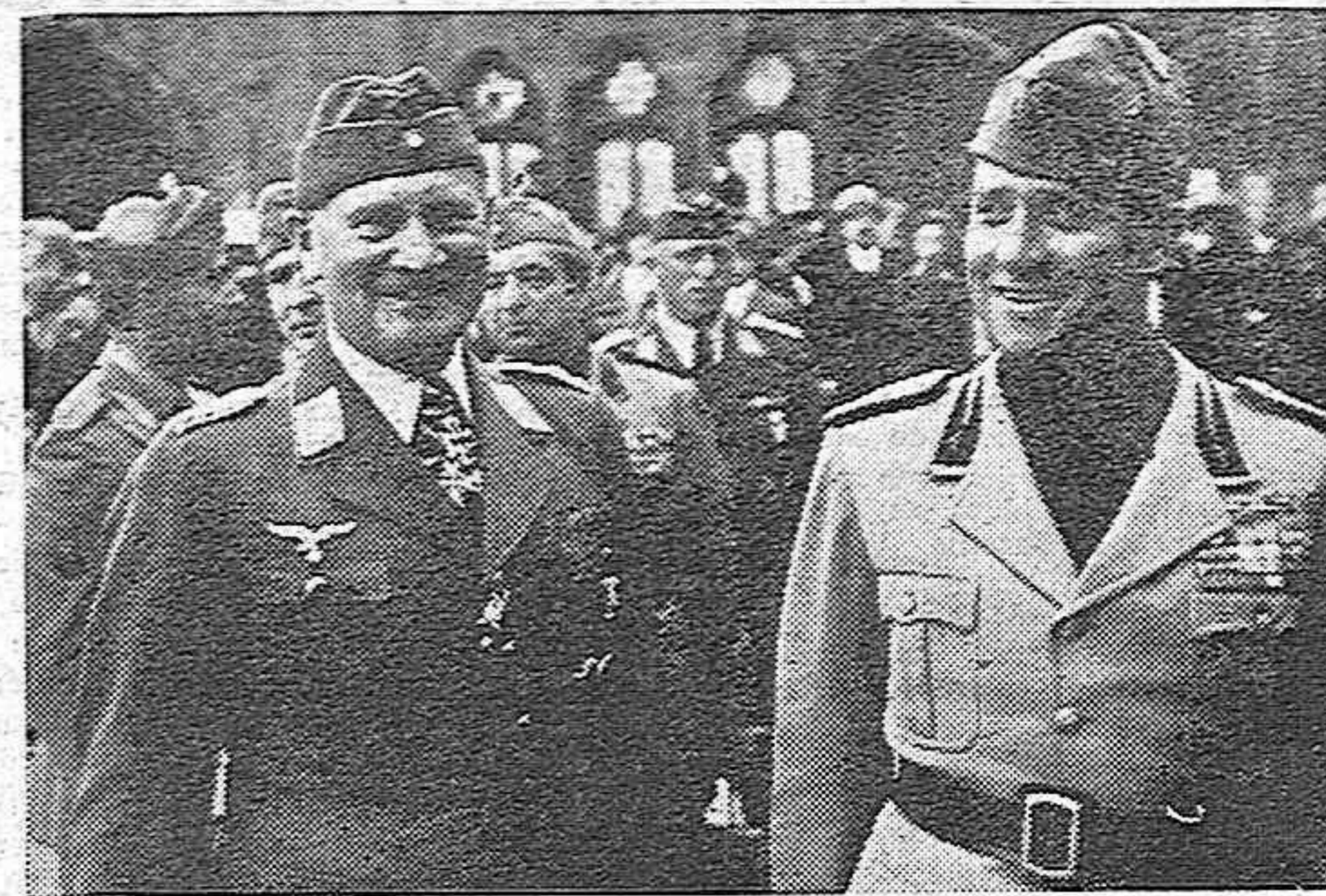
EL CONDE CIANO, DURANTE SU VISITA A BRUJAS, ACOMPAÑADO DEL TENIENTE GENERAL LOERZER