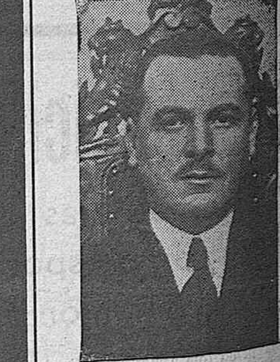
Doctor Palanca, director general de Sanidad, a quien le ha sido concedida la cruz de oficial de la Corona de Italia, distinción que hace el Gobierno italiano a ilustre catedrático.

Alemania cede territorios a Eslovaquia Berlín, 21 (6,15 t).—Ven Ribbentrop y el ministro de Eslovaquia han firmado un tratado por el que se cede a Eslovaquia todos los territorios que la antigua Polonia había anexionado en los años 1920, 1938 y 1939. Con esto ha quedado cumplida la promesa del Führer al Gobierno de Eslovaquia, en la que prometió atender sus justas aspiraciones.—EFE.