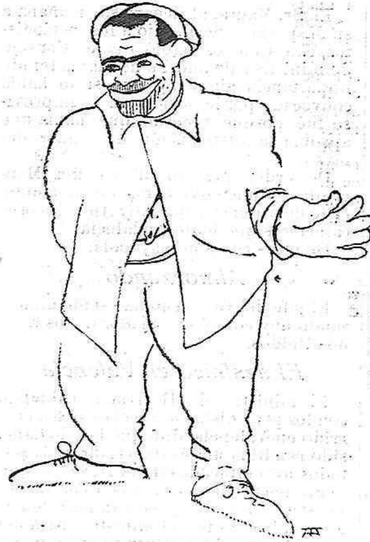
—Si me se estaba figurando a mí.

Al conjuro de tal nombre, un relámpago de ira ha cruzado el rostro avieso de Sánchez Rubio.