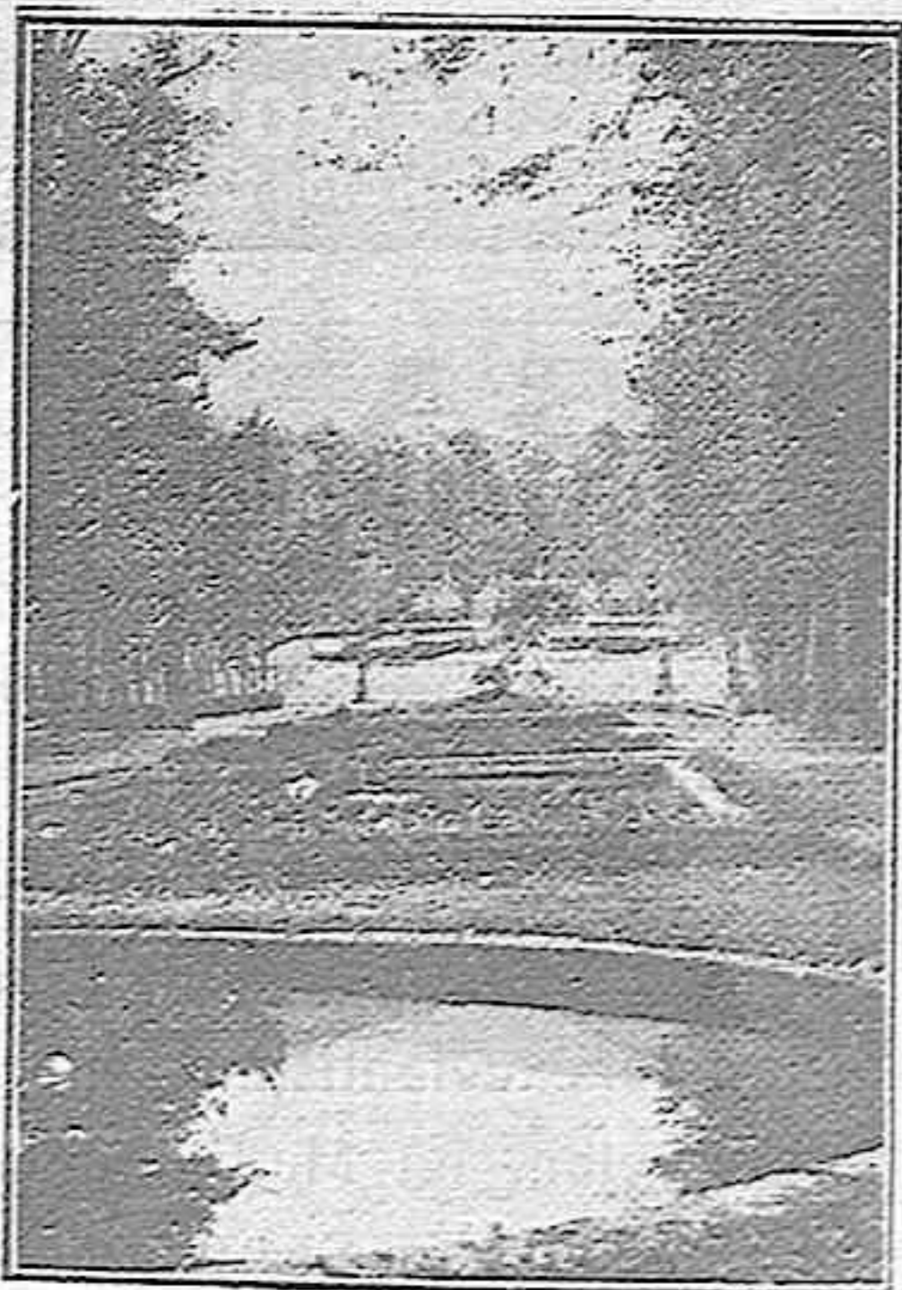
San Ildefonso.—Vista parcial de los jardines

Y el prestigio de los jardines y las fuentes de La Granja creció con el tiempo, y en los distintos días del año en que las aguas corren, una peregrinación de gentes de todas las regiones españolas, y muchas también de extrañas tierras, se agolpan en torno de los surtidores, y contemplan extasiadas cómo el agua se desborda en potentes cascadas, en hilos sutilísimos