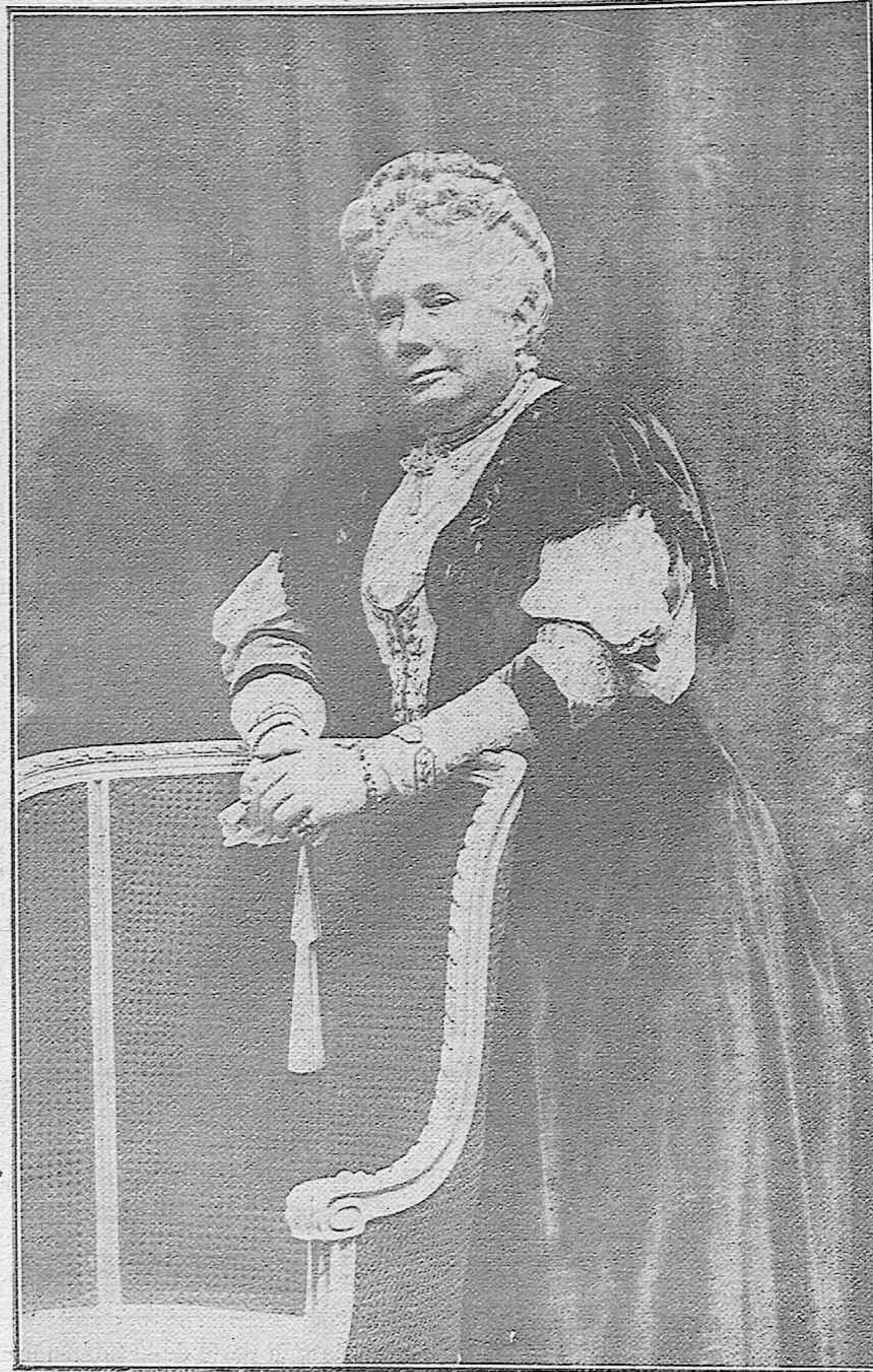
S. A. R. la Infanta doña Isabel de Borbón, condesa de Segovia

que tejen mágicas combinaciones, irisadas por la luz del sol.