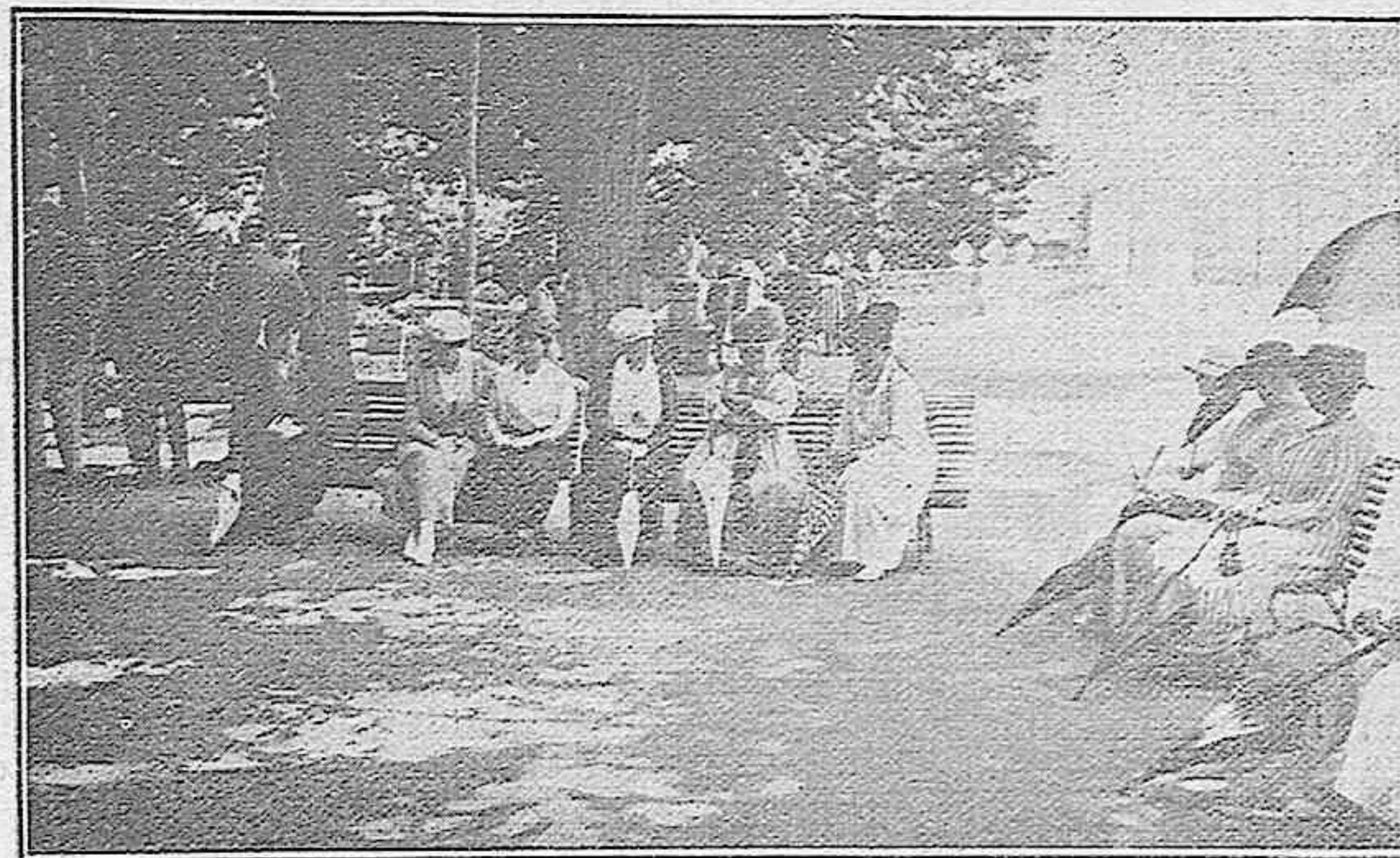
San Ildefonso.—S. A. R. la infanta doña Isabel en el «corro»