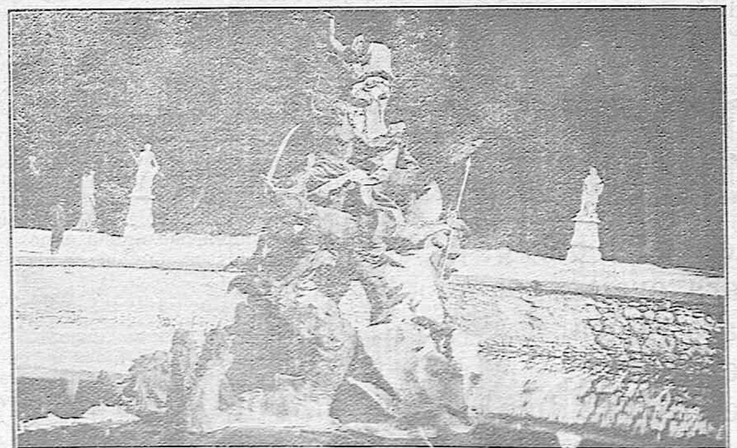
San Ildefonso.—La fuente de la Fama