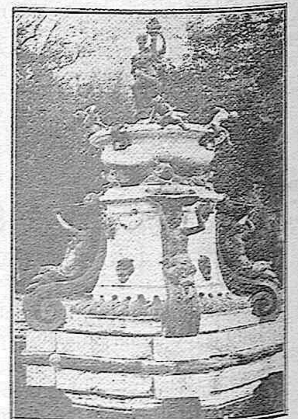
San Ildefonso.—Fuente de la Taza