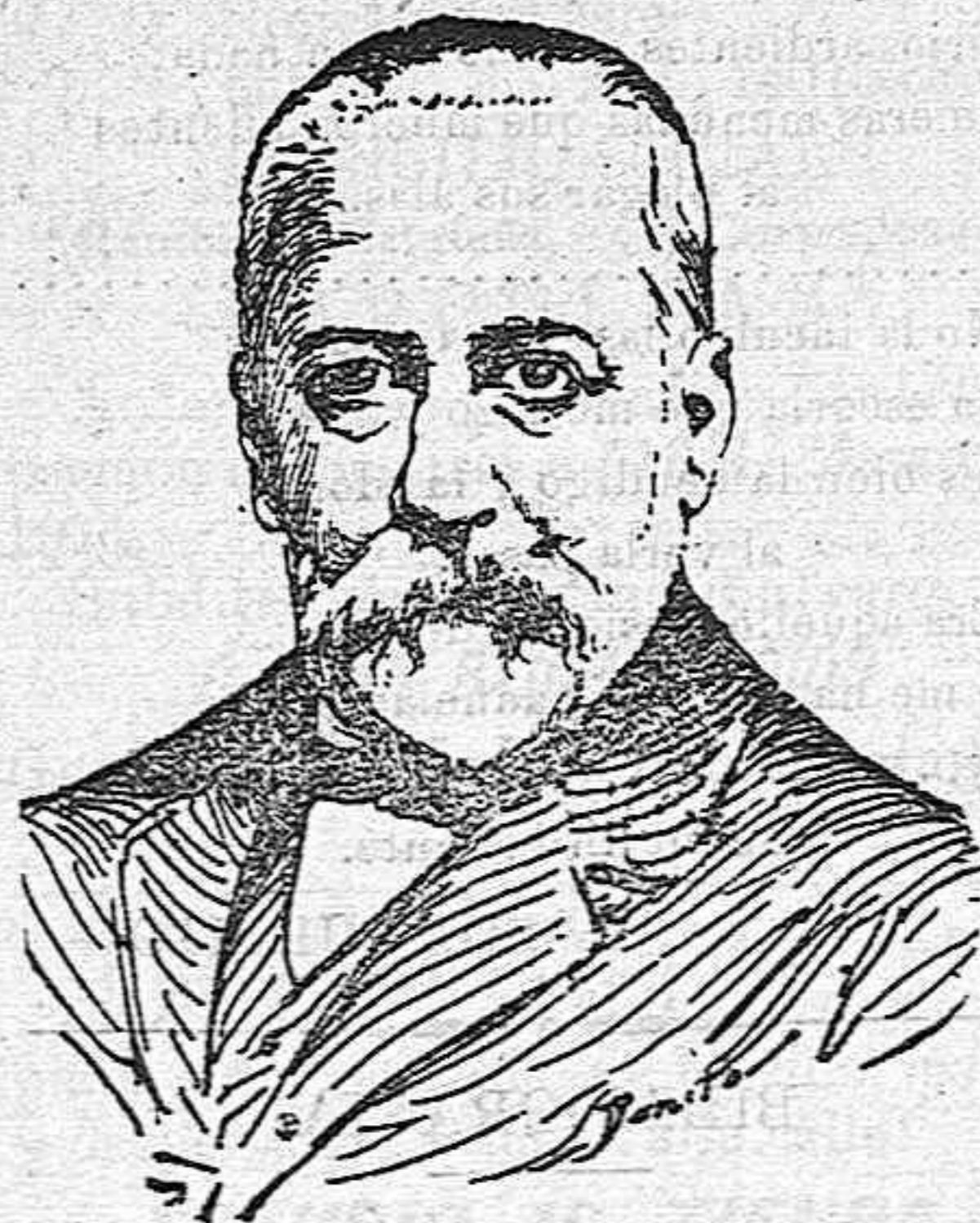
El insigne polígrafo y académico D. Marcelino Menéndez y Pelayo, cuya muerte llora hoy España entera.

Pocas días hace, hablando de la colección completa de las obras del ilustre Menéndez y Pelayo, decíamos que, tratándose del que era a la vez erudito, pensador, escritor, polemista y poeta; del que llamó, con exactísima frase, el elocuentísimo D. Alejandro Pidal, gran mantenedor del genio y de la cultura nacional, no era posible decir nada nuevo en su elogio, porque la crítica, dentro y fuera de España, lo ha dicho todo, creyendo cumplir un elemental deber de justicia al agotar el elogio en obsequio de esa magna labor que de tan brillantísima manera ha enlazado nuestras hermosas tradiciones literarias y filosóficas con los desenvolvimientos del pensamiento moderno.