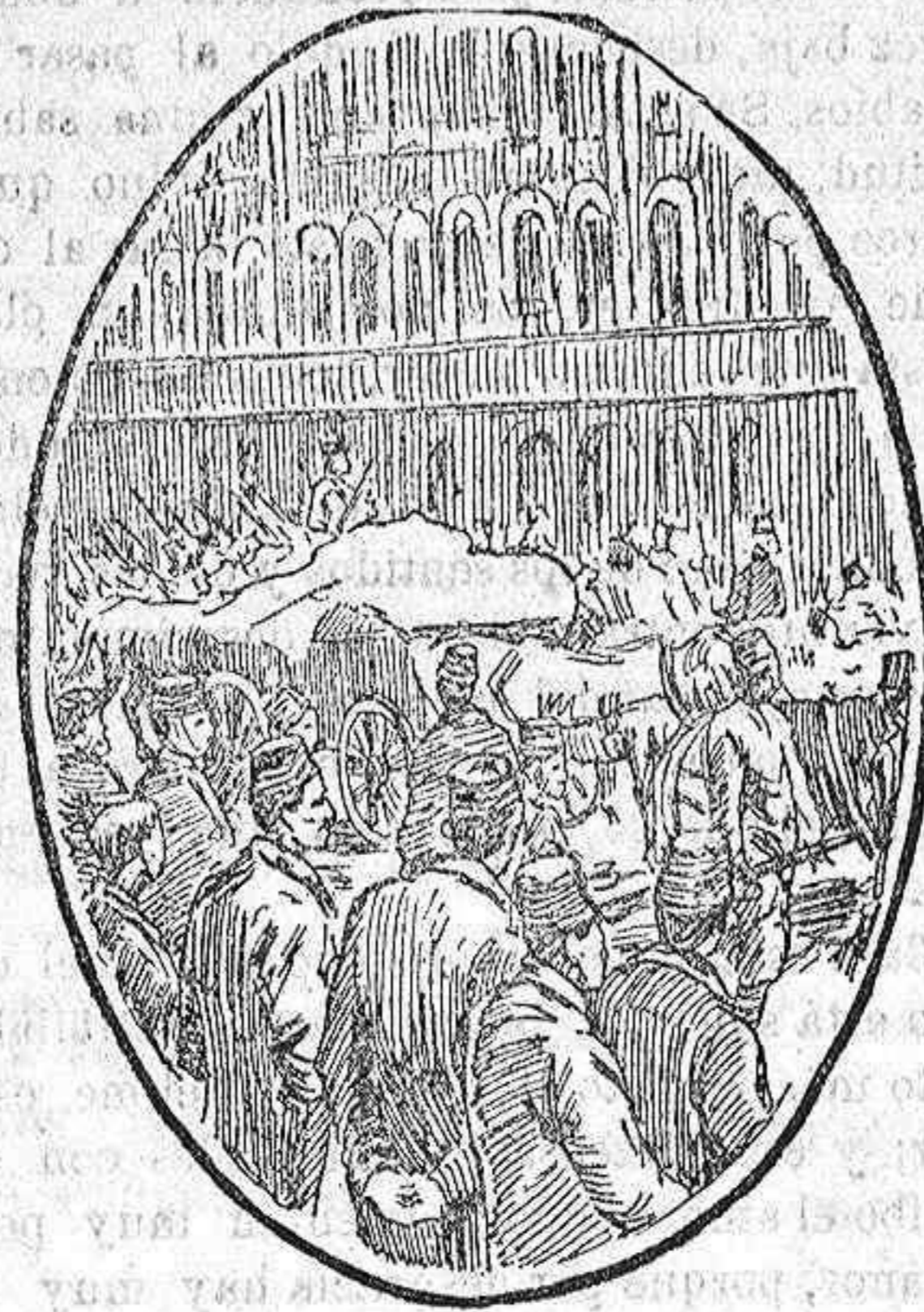
Tropas turcas saliendo del cuartel de Taxim (Constantinopla), para embarcar con dirección a Trípoli.