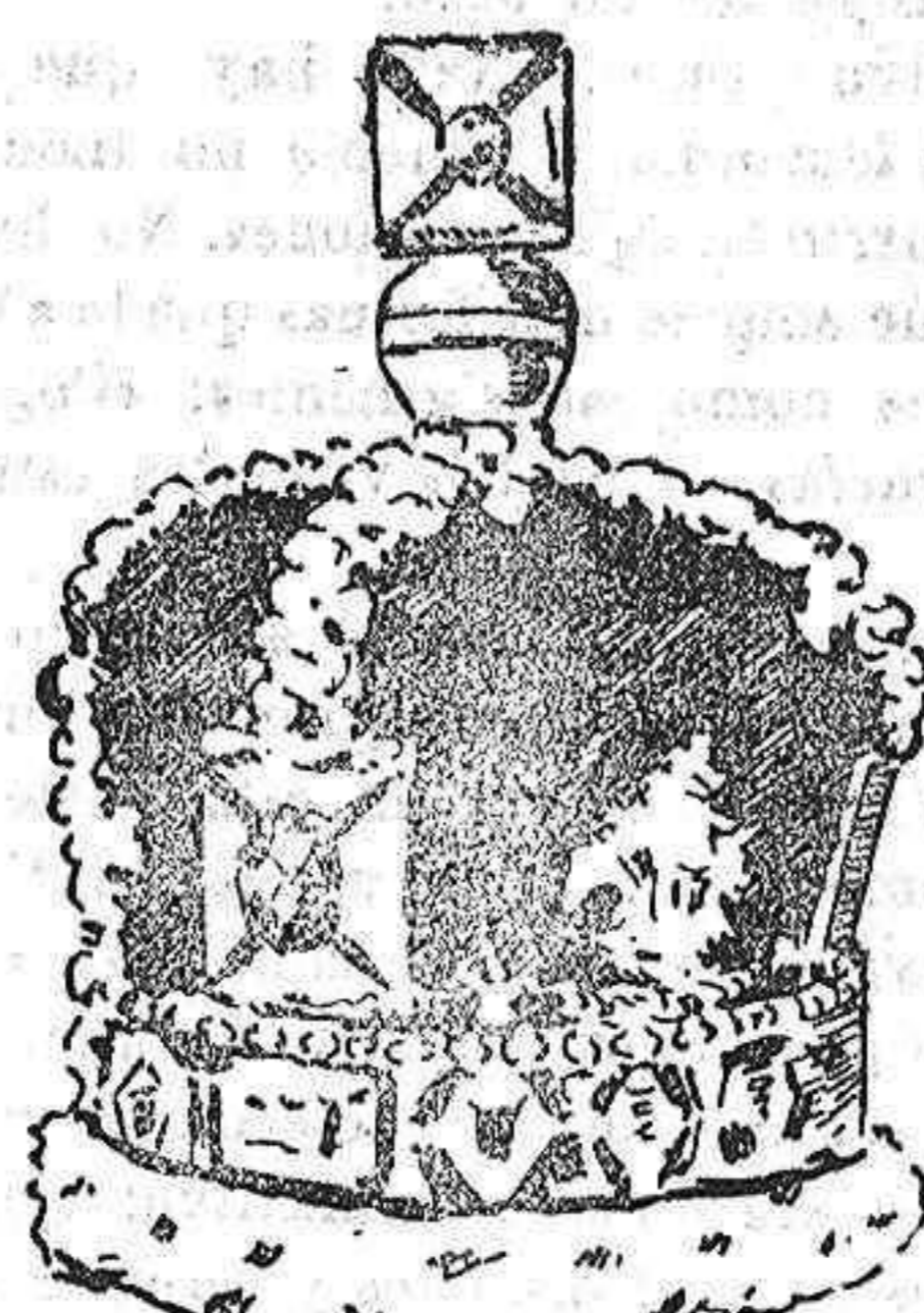
Corona de Jorge V