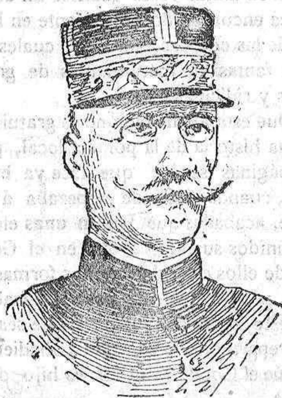
El general Moinier

Y tan pensada debe ser la marcha de la columna Brulard, que ha dado tiempo á que se le incorpore el general Moinier con algunas fuerzas.