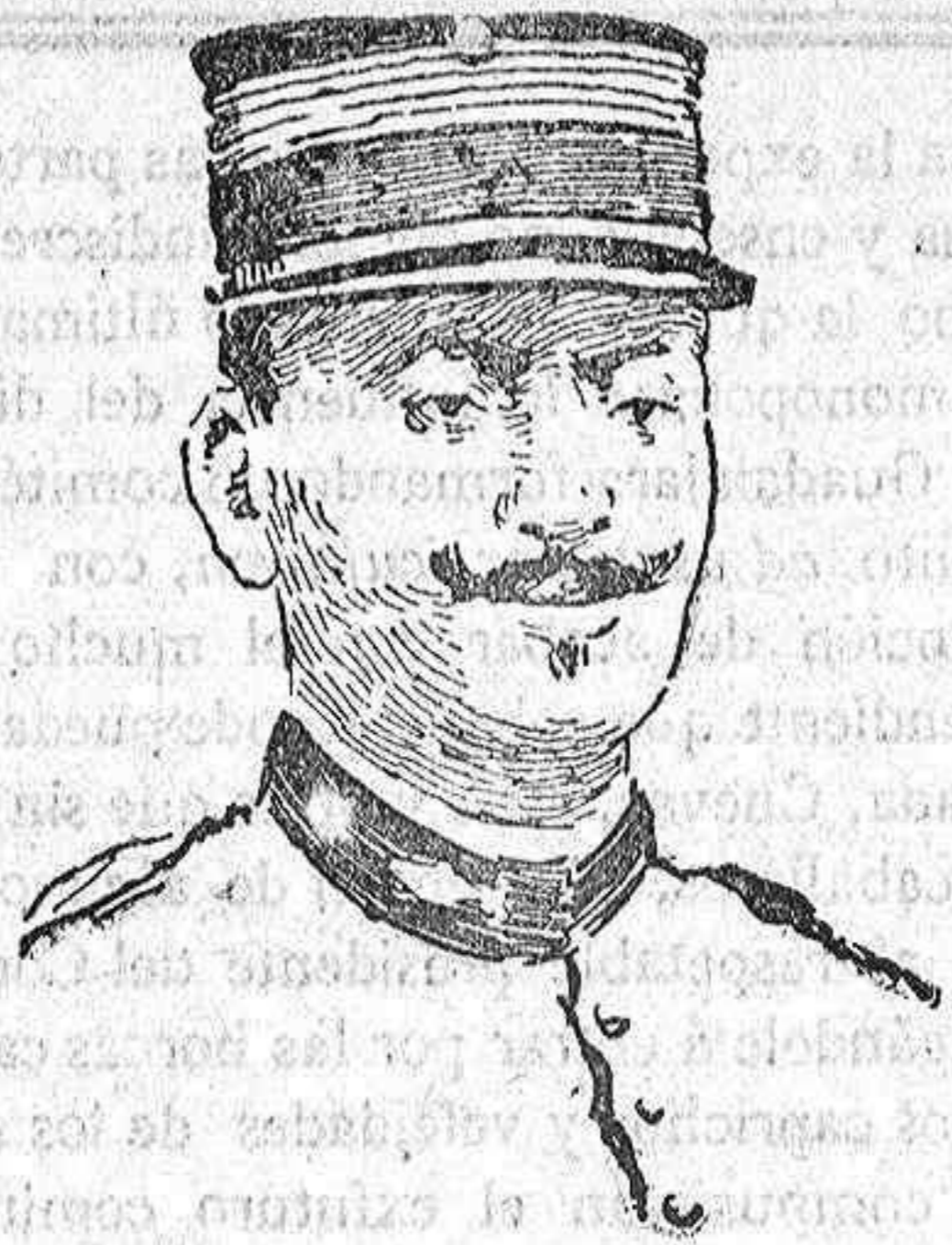
El coronel Brulard

Si una vez más no resultan exageradas, ó totalmente opuestas á la realidad de los hechos, las noticias últimamente recibidas de Fez, la situación de los sitiados ha vuelto á ser crítica en extremo. Sus esperanzas de salvación cifranlas en la oportuna llegada de la columna del coronel Brulard, como á fines de Abril poníanlas todas en la de la mehalla del comandante Bremond.