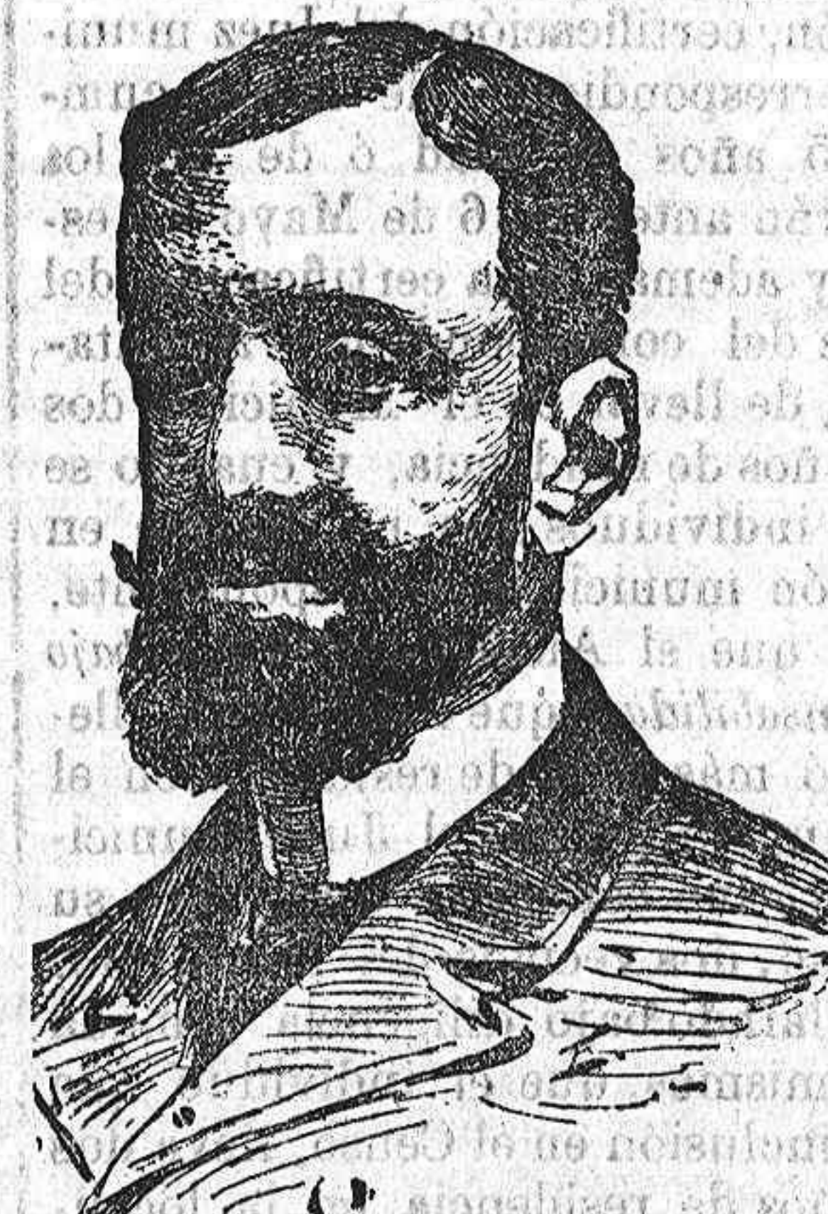
Sr. Villanueva, nuevo Ministro de Fomento,