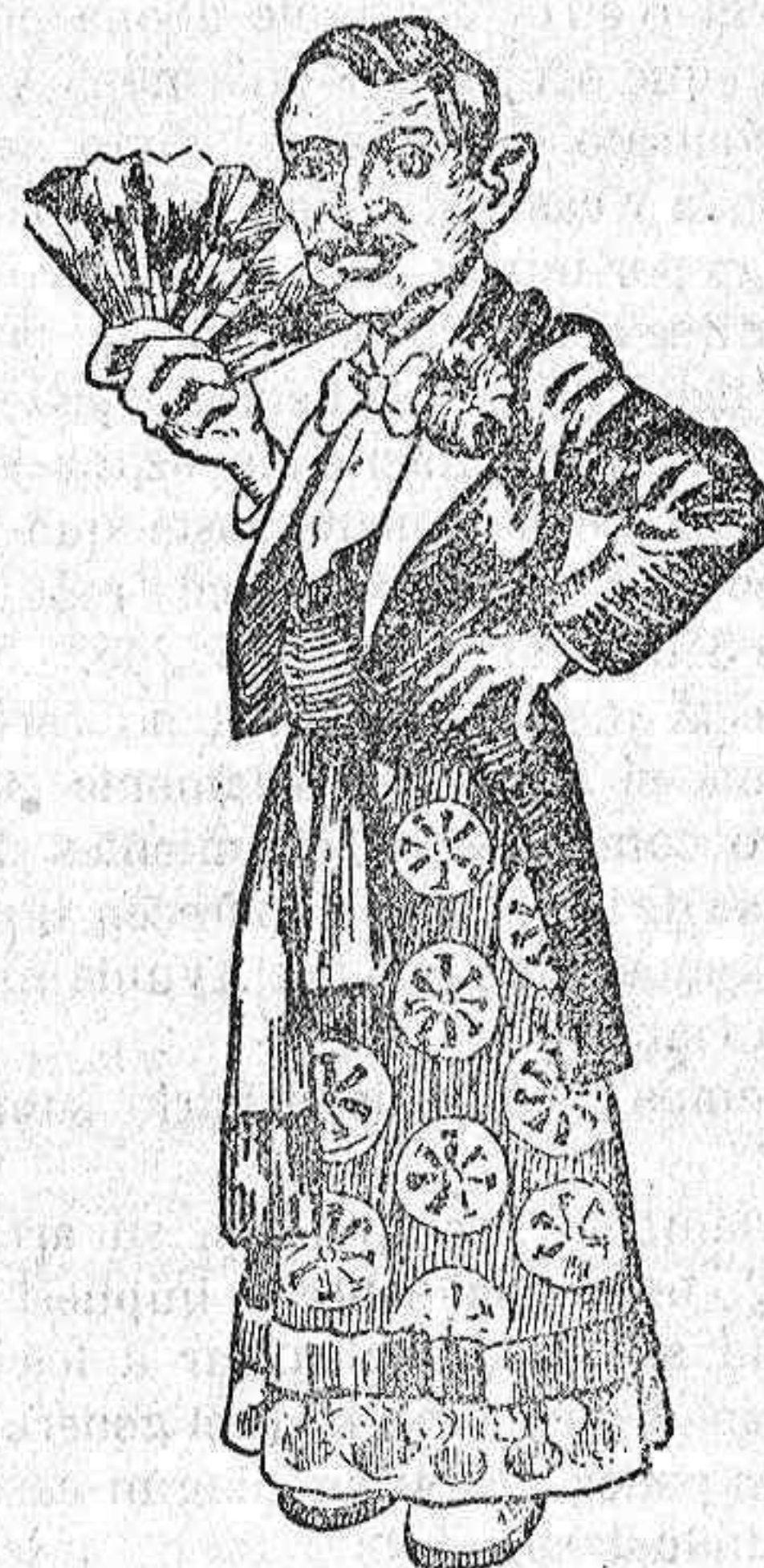
El Dr. Sun Yut-Sen, presidente de la República China