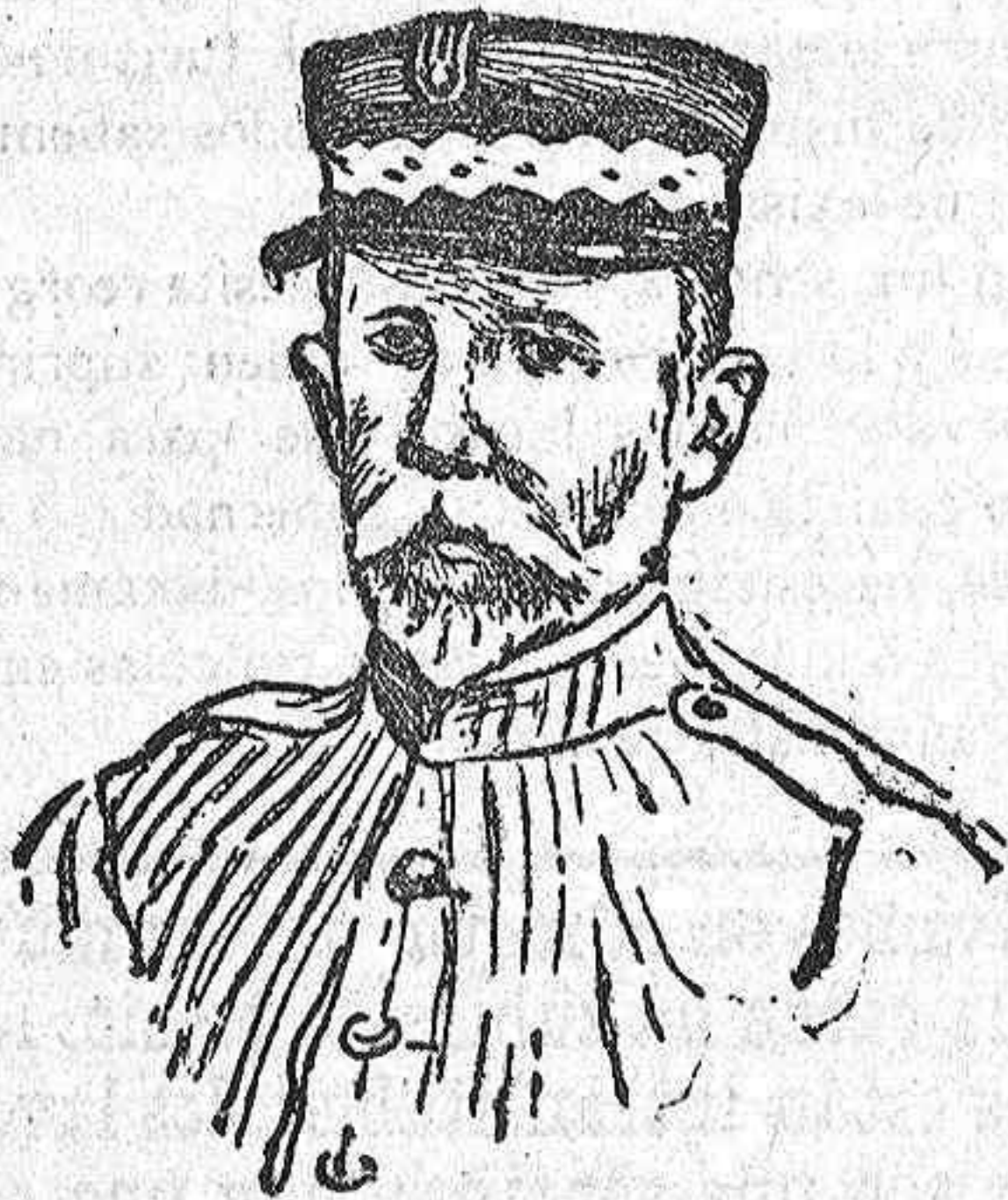
El general Larrea, jefe de una de las divisiones del Ejército de operaciones de Melilla