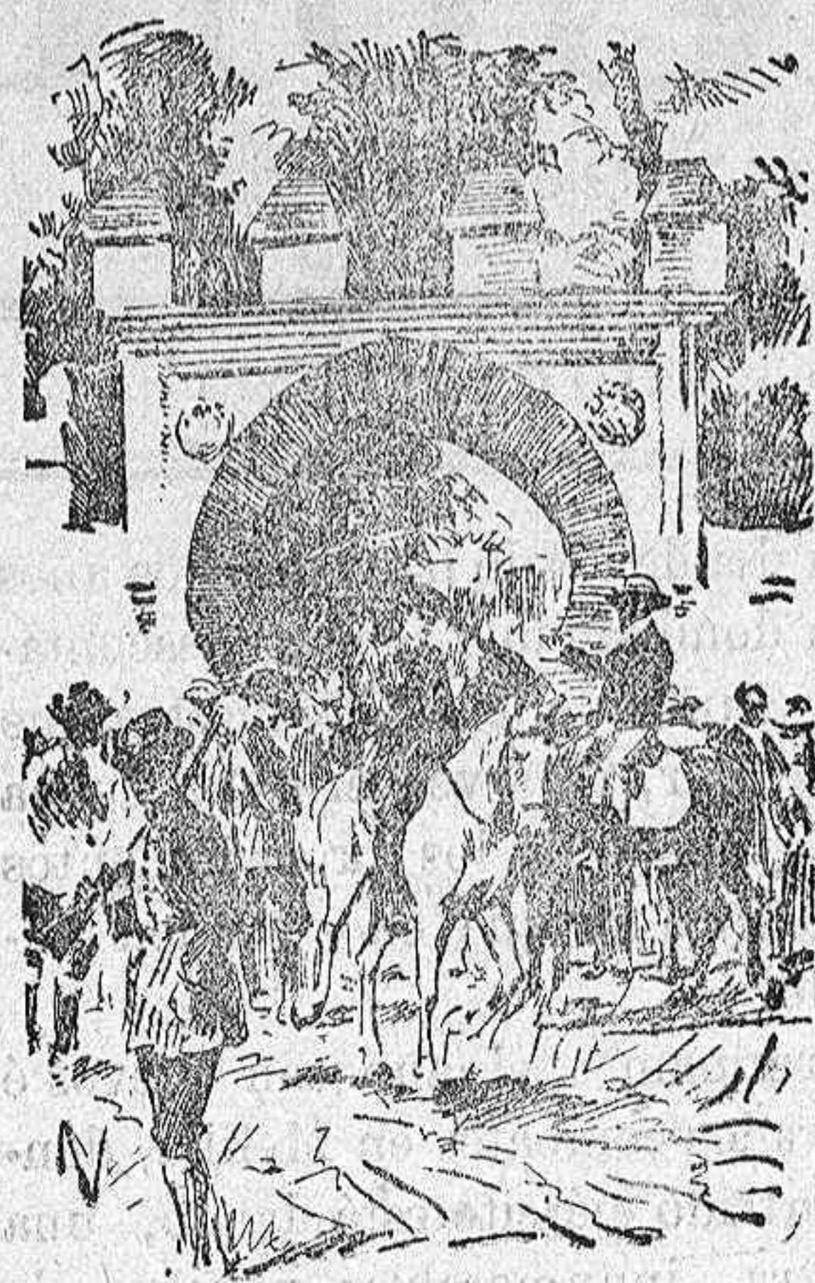
Los cazadores disponiéndose a partir para la cacería.

Al cabo de los años los montes de Lachar vuelven a ser objeto de una excursión cinegética en honor del rey de España.