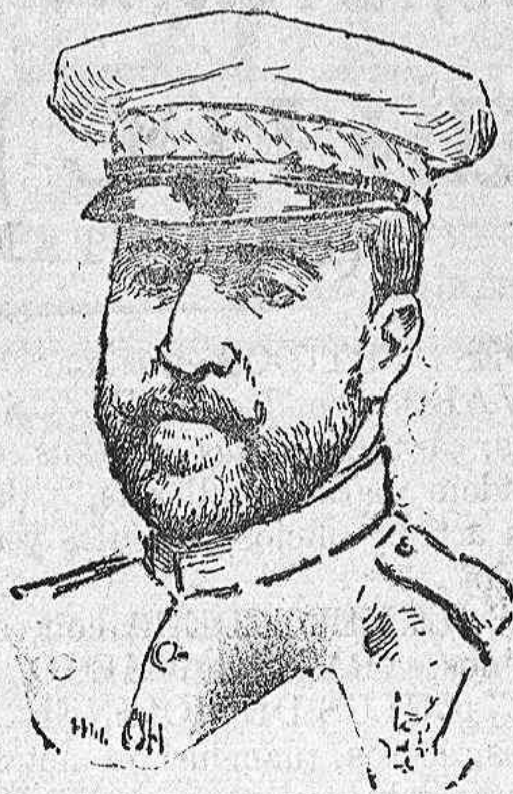
El general Aguilera vencedor de los últimos combates

Lo que ahora ocurre en América nos permite preverlo desde luego.