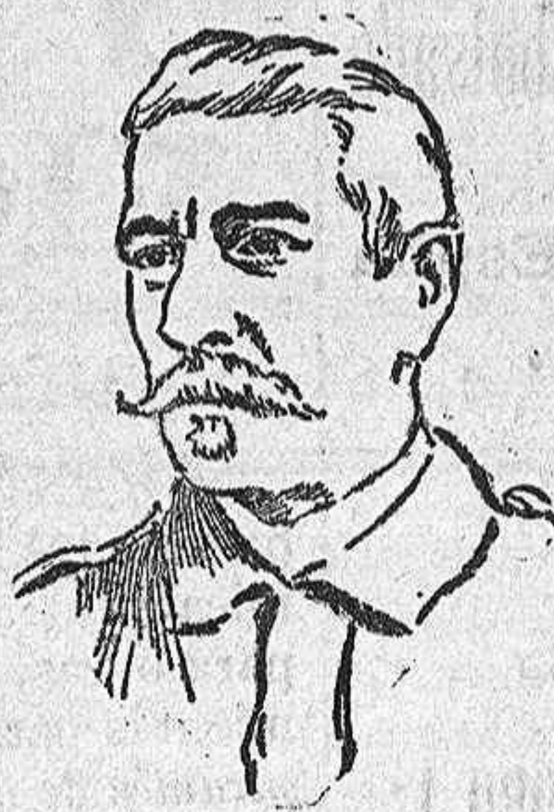
El General Ros herido gravemente