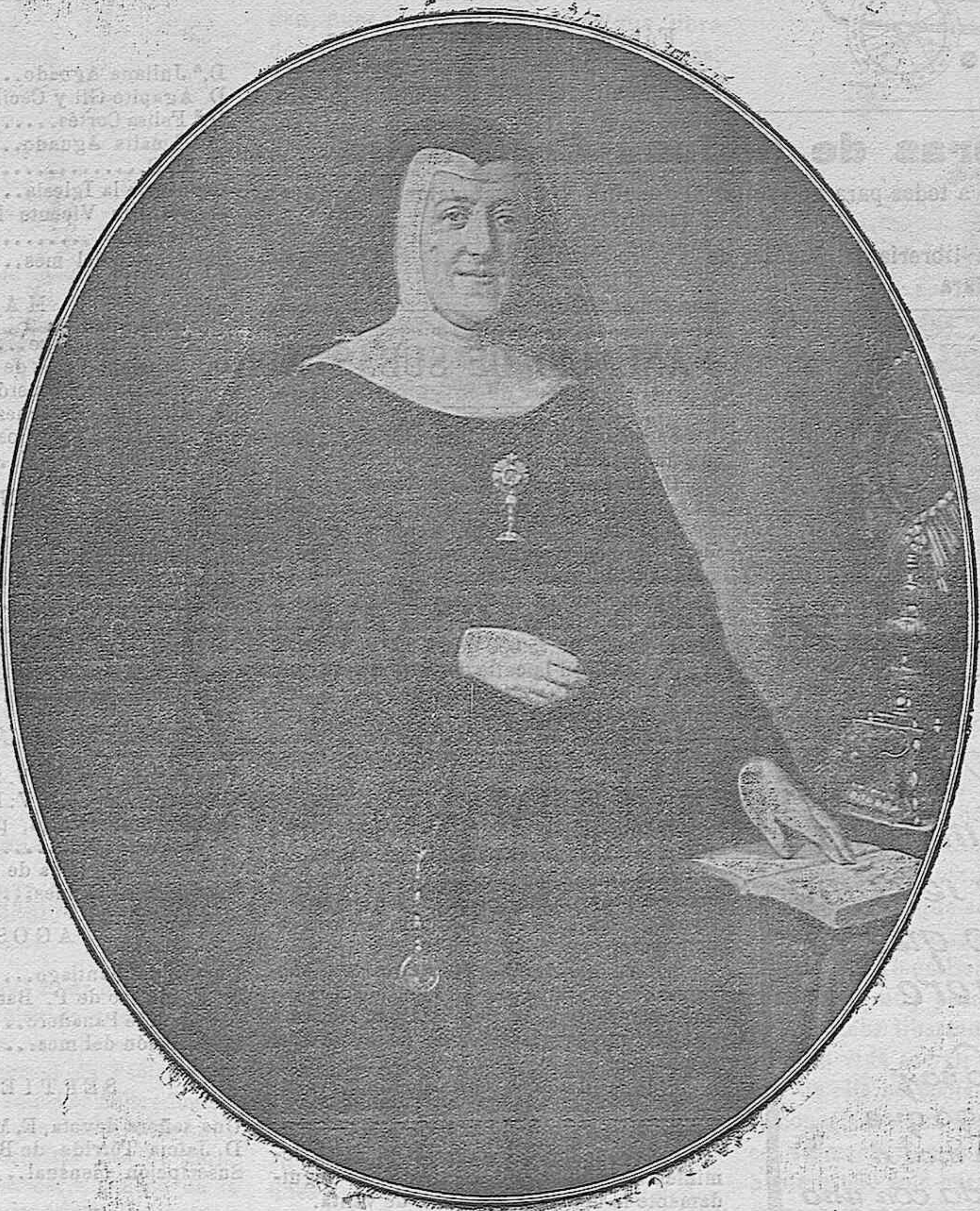
MARÍA MICAELA DEL SANTÍSIMO SACRAMENTO (En el mundo Vizcondesa de Jorbalán)

Su venerable fundadora está ligada a Guadalajara por vínculos bien agra-dados y lazos estrechos. María de la Soledad Micaela Desmaisieres López de Dicastillo, conocida y llamada luego con solo el nombre de Micaela, Vizcondesa de Jorbalán andando el tiempo, y Madre Sacramento al coronar su vida en el Instituto de su fundación, descendía de una de las familias más antiguas y de más alcurnia establecidas en esta población.