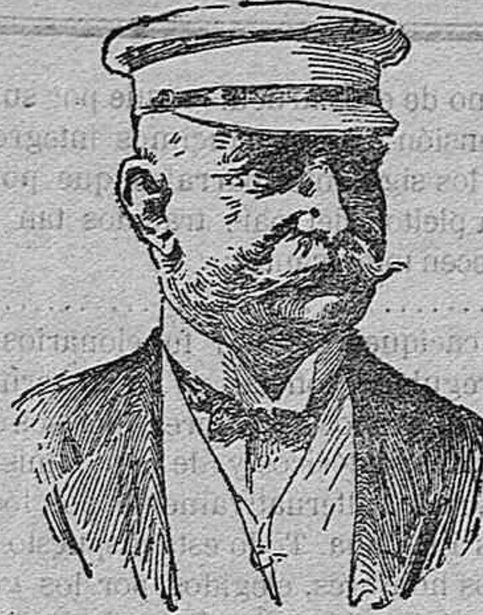
El conde Zeppelin

Indudablemente, el emperador Guillermo es el soberano de más «mano izquierda» que existe y ha existido en el mundo. Véase, sino, su última habilidad.