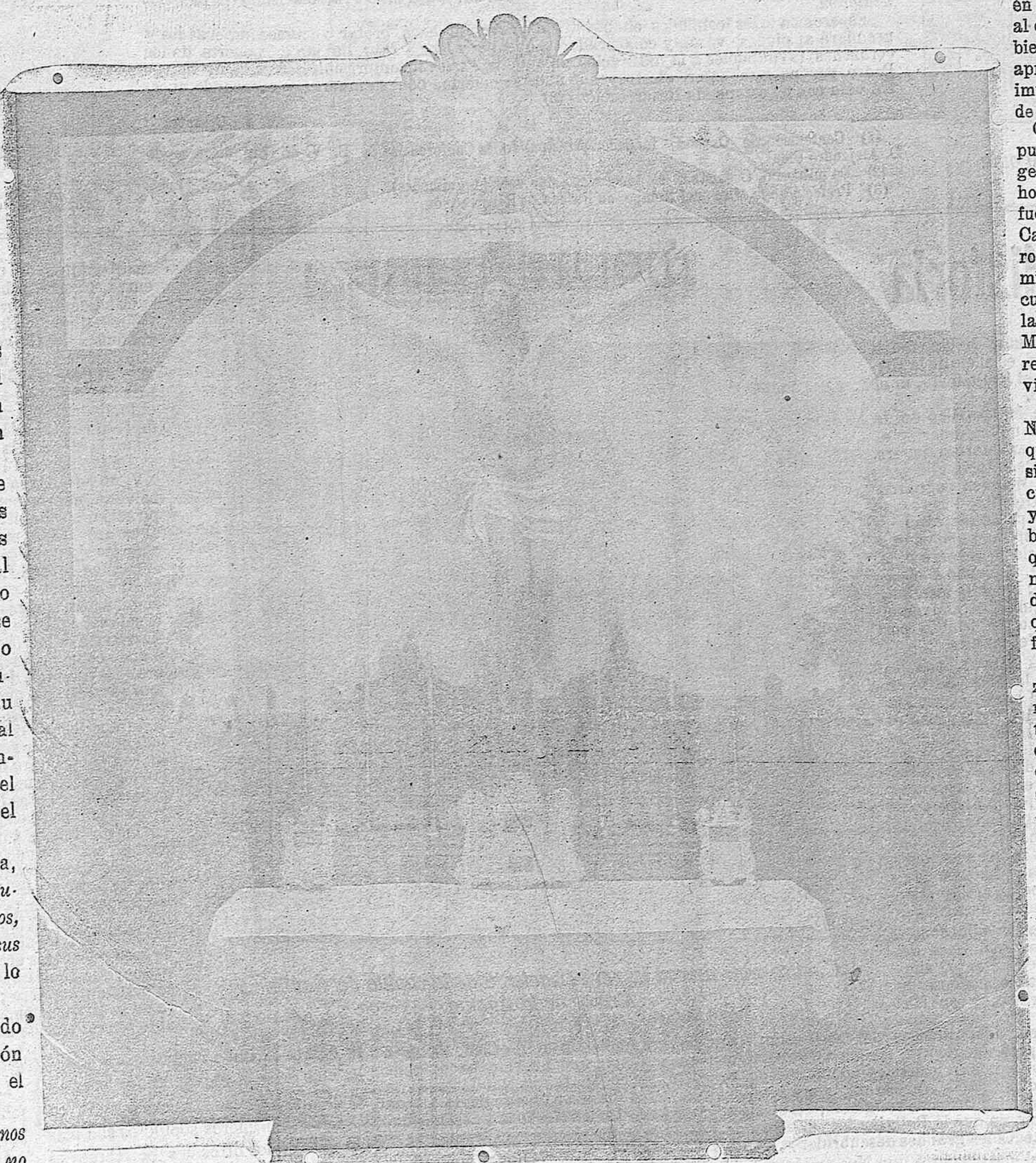
El Santísimo Cristo de la Agonia en su nueva capilla

Y como es Providencial, todo se cumplirá y llegará el momento en que fijos los ojos y el pensamiento en el Redentor, terminen las luchas egoistas, y triunfen los buenos, pero sin daño, sin represalias, para los malos. ¡Amor! ¡Perdón! ¡Misericordia! como su último suspiro, que de misericordia, de perdón y amor, fué.