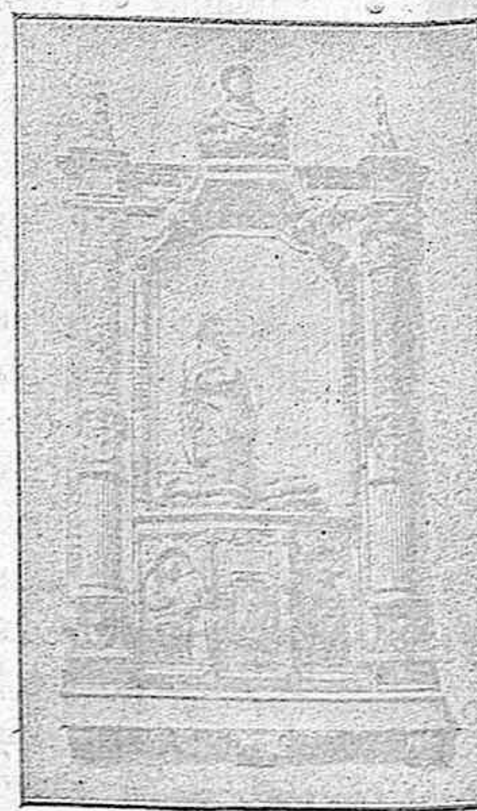
Sepulcro de D. Pedro Hurtado de Mendoza.