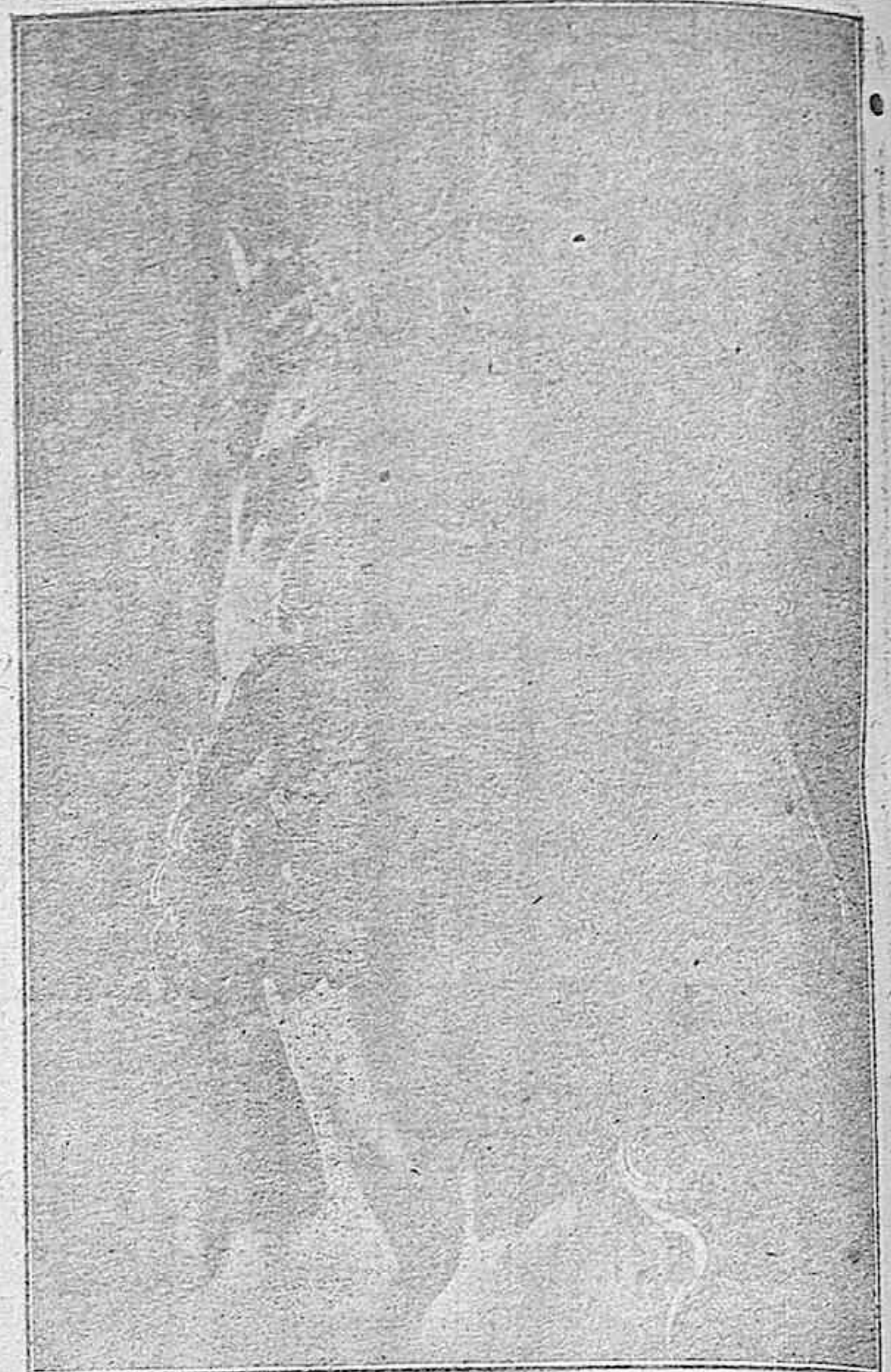
Busto del Santisimo Cristo de la Agonia