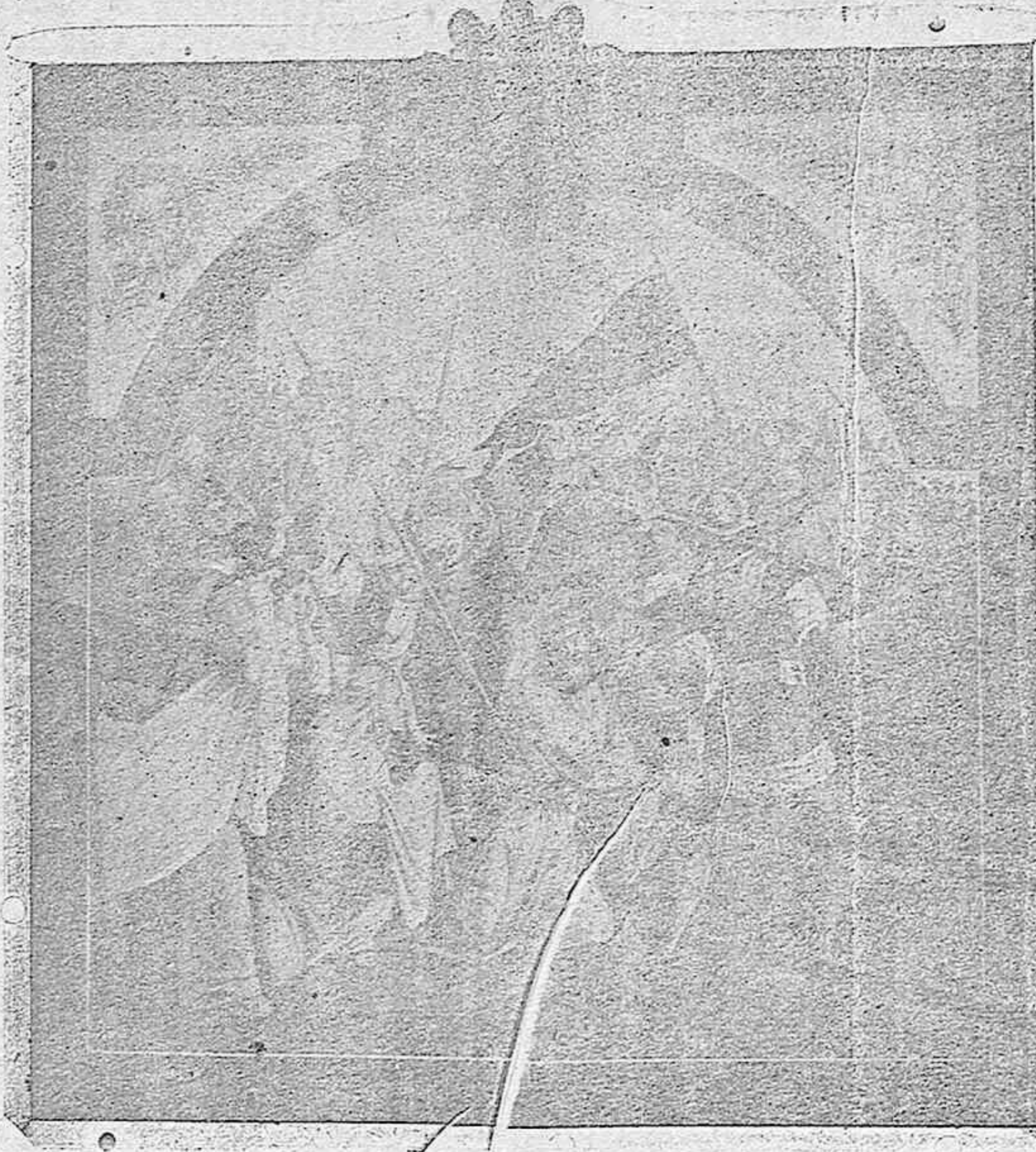
Cuadro que decora la parte izquierda de la capilla del Santisimo Cristo de la Agonia.

ría Magdalena, la mujer arrepentida, «pasionaria de amor enredada en el árbol de la Cruz».