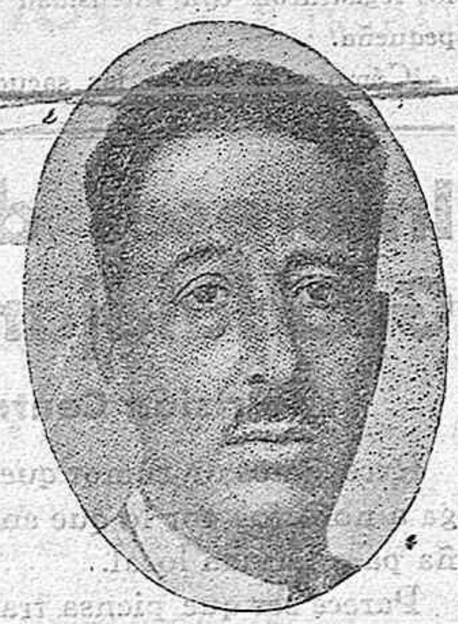
Luis Companys, el ferviente republicano perseguido y encarcelado por la monarquía. Hoy en la cárcel, encarna las aspiraciones de las masas izquierdistas ansiosas de libertad y justicia social, así como las de los catalanes que hacen compatible una legítima autonomía con el espíritu generoso y humano de la República.