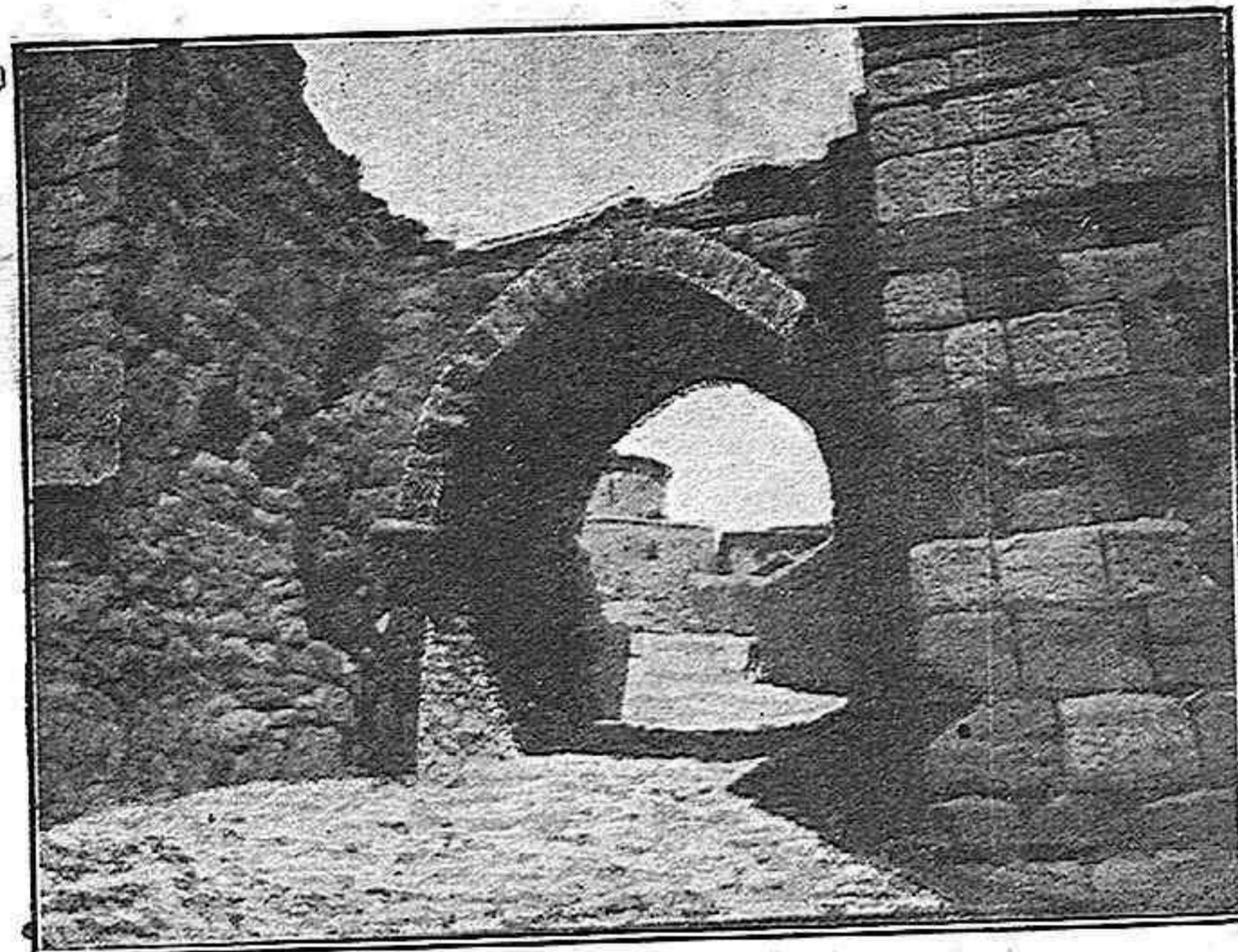
ATIENZA.—El Arco de Guerra.

Es ese mismo aire que, agitado en su marcha, denominamos viento. Esa ráfaga impetuosa que en