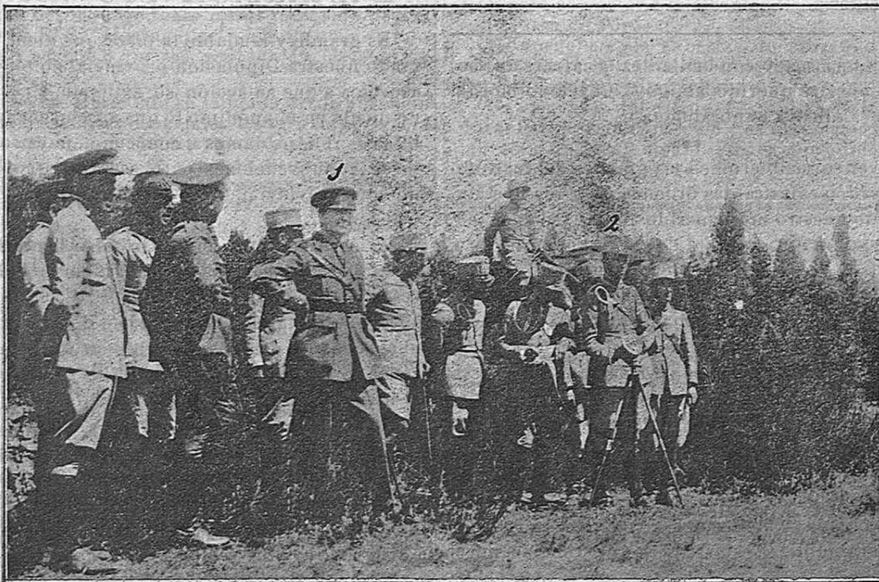
S. A. el Infante D. Fernando de Baviera (1) presenciando las prácticas de «Pajera», viéndose también a su hijo el Infante D. Luis (2), maniobrando con el heliógrafo.

Pozo de Almóguera.—Habiendo recibido el Excelentísimo Sr. Gobernador civil algunas denun-