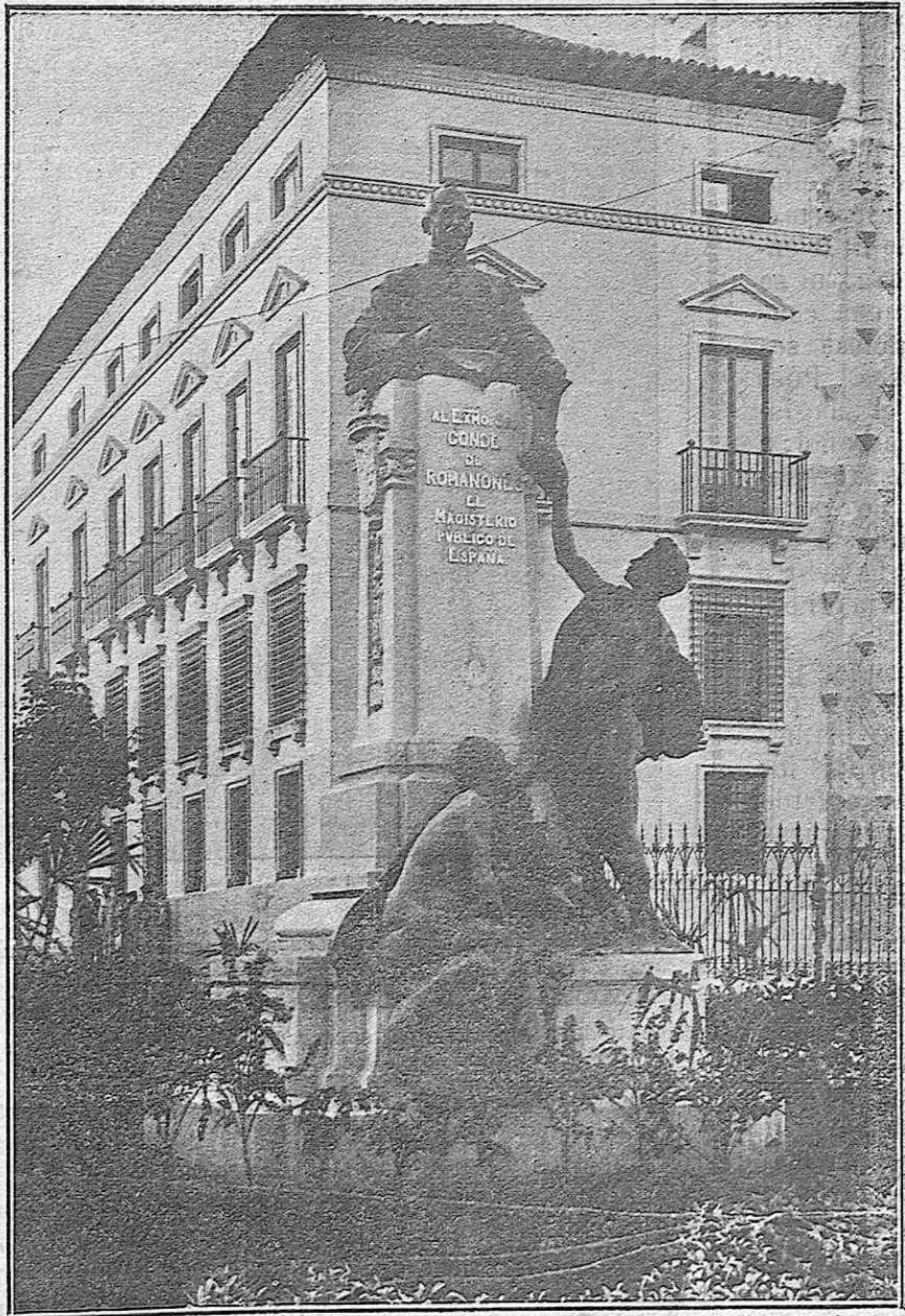
Monumento dedicado al Excmo. Sr. Conde de Romanones por los Maestros españoles, que se inaugurarà hoy