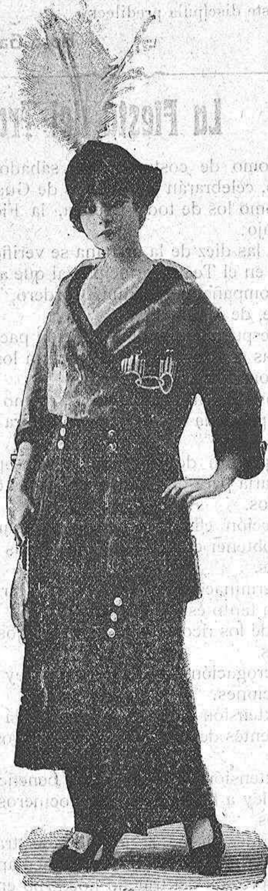
Traje de 'liberty', negro y muselina verde, adornado con 'moire', verde Modelo Beer, de París