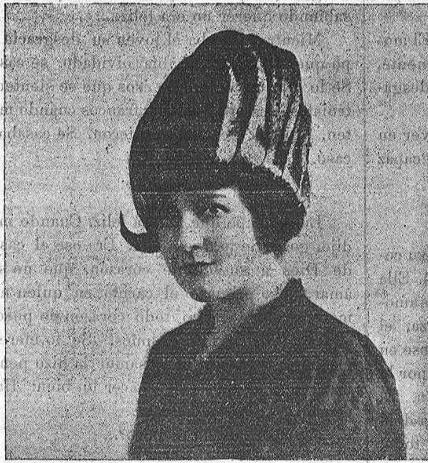
Sombrero de "Picot tango", modelo Monna Canda. Paris

Para el baño de río, se tomarán las mismas precauciones que para el de ola. Después de una tormenta, absteneos del baño: las aguas del río estarán turbias y terrosas. Tampoco hay que bañarse los días lluviosos o algo frescos que suele haber en el verano.