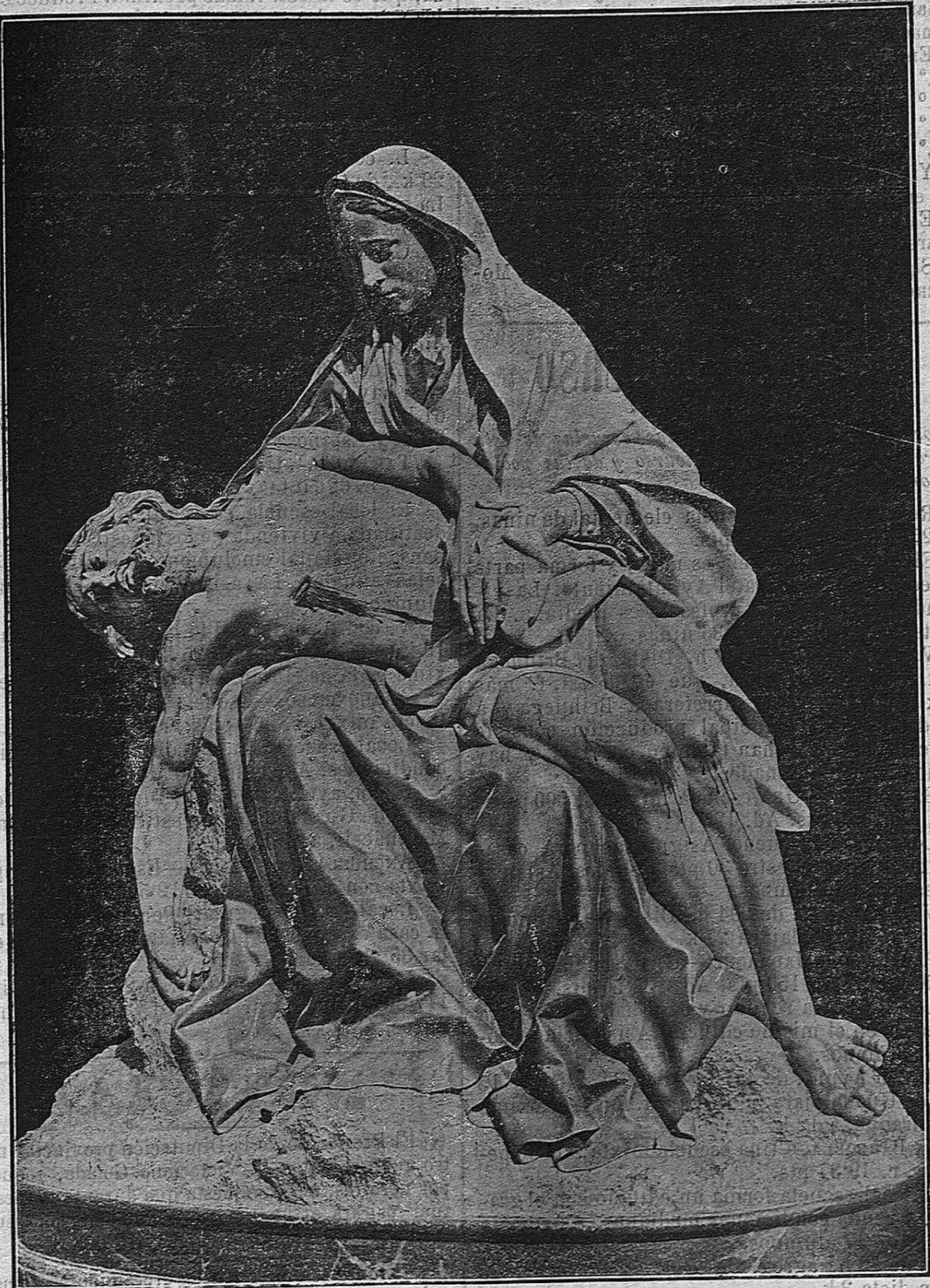
La Virgen, angustiada, con el cuerpo de su Divino Hijo