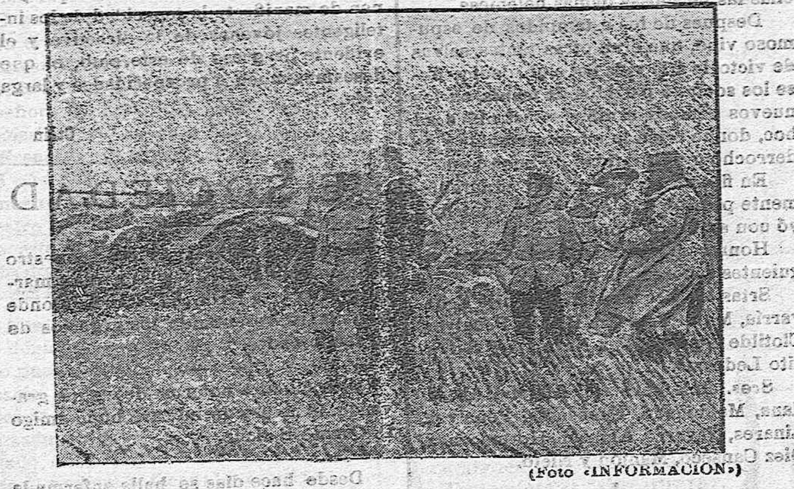
Mr. David, Ministro de Agricultura, presenciando la recolección en las regiones conquistadas.

riores a fin de darse cuenta de la triste situación de los campesinos rusos y de la razón de sus reivindicaciones. Dichos informes le han sido suministrados al ilustre economista francés por el mismo ministro ruso de Agricultura, M. Tchernoff. Los censos que los aldeanos debían abonar a cambio de las tierras eran tan crecidos que excedían ante la renta natural de las posesiones... Mientras que puede evaluarse en 650 millones de rublos el rendimiento anual de la Rusia agrícola, las rentas negadas por los mujiks alcanzaban 870 millones de rublos, sea un pasivo para los trabajadores rurales, de 220 millones de rublos. Claro es que había pedido obtenerse resultados mejores, si el Gobierno imperial hubiera ocupado de mejorar los procedimientos de cultivo; pero esta era la meta de sus inquietudes. El campesinado ruso, abandonado a sí propio obtenía cosechas ínfimas. Mientras que el Canadá recolectaba en 1906, 96 pounds de trigo por hectárea, Rusia solo recogía 34. Y lo mismo ocurría con el centeno: en Dinamarca se cosechaba 125 pounds y en el Imperio eslavo 39. Pero, mientras que en Noruega y en Hungría, por ejemplo, se gastaba para el mejoramiento de la tierra una cantidad media de 2 rublos y 10 kopeks por hectárea, Rusia dedicaba apenas de 5 a 6 kopeks. Estas cifras, como se ve, son tan elocuentes que hacen ocioso todo comentario. Lázaro VAGDOLA