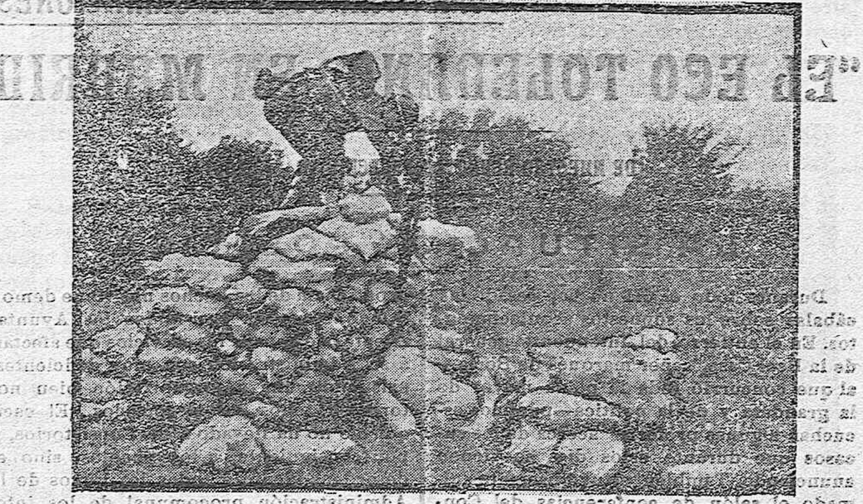
El salto de las trincheras

Desde que el ejército americano tomó parte en la contienda europea, ha venido dando muestras de haber recibido una instrucción detenida, preparando hombres útiles para la guerra.