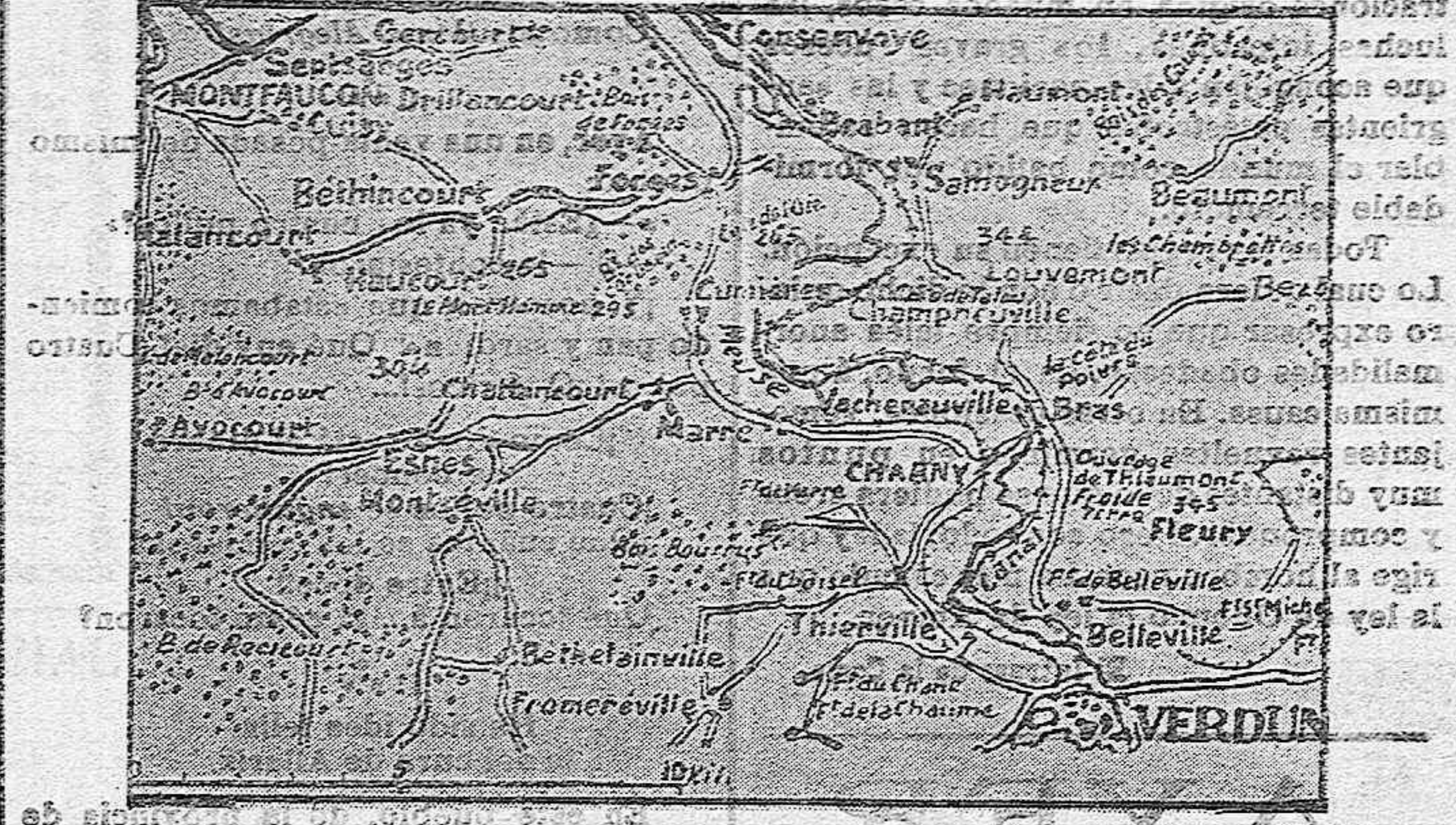
Mapa de la región de Verdun

de una rescoción de la raza, de la degeneración de la raza española. Y qué vergüenza sentir al comprender la verdad del tumulto, el origen del escándalo! ¡Ya nos regeneremos! ZIRTO