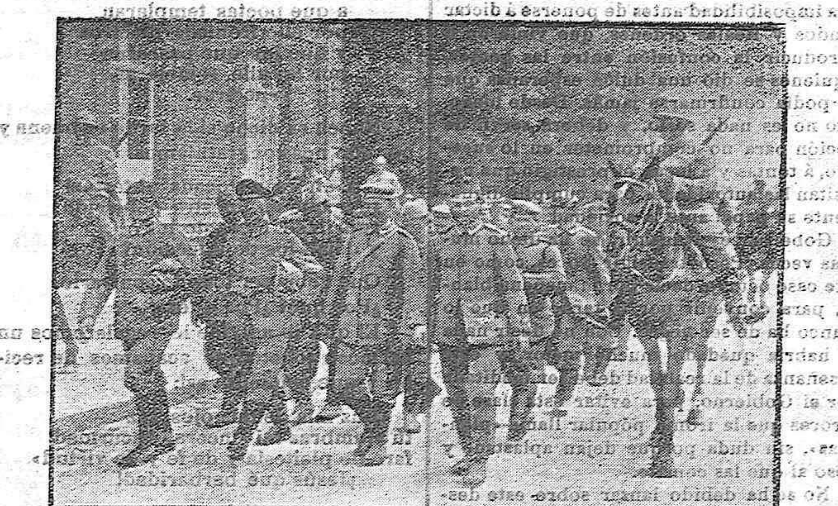
CONDUCCIÓN DE PRISIONEROS

En correcta formación, y bajo la vigilancia inmediata de los soldados, véase aquí un grupo de prisioneros, que son conducidos desde los diversos frentes de batalla a los campamentos de concentración, efectuando jornadas y formando para cruzar las poblaciones del camino. La ley de los prisioneros de guerra, crea ahora nuevas orientaciones, sobre este particular. La guerra sin cuartel, a veces necesaria por la actitud del enemigo ó a manera de represalias, y de la que tantos ejemplos nos muestran las pretéritas campañas, se ha deserrado ya de los campos de batalla, al natural impulso de la civilización; antes, los prisioneros eran degollados, y con carácter ejecutivo, al entregarse, recibían el golpe de gracia, con el que hacíase merecida justicia a la cobardía y bajesa de los que depositan sus armas en espera de una redención de penalidades y fatigas, sin tener en cuenta