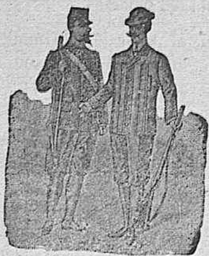
Figura 10.—Traje de hilo negro satinado ó á rayas, color sólido, 60 pesetas.

Figura 11.—Traje de hilo inglés á cuadros de gran novedad, variación en colores y dibujos, 80 pesetas.