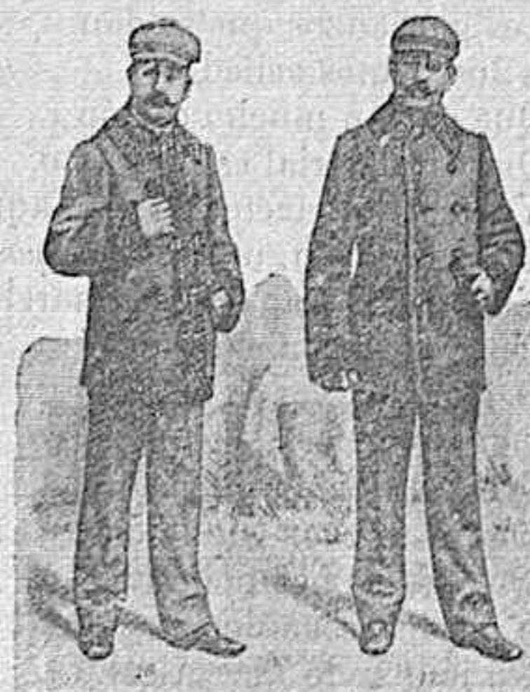
Figura 16.—Pelliza, adornada de rizo, muletillas de pasamanería, sin forros, de mucho abrigo, 45 pesetas. La misma forma y adornos, forrada toda, en castores azul, verde ó café, de primera todo, 90 pesetas.

DE NUESTRO CATALOGO DE PRENDAS DE CAZA, CAMPO Y SPORT MOISÉS SANCHA CRUZ, 12, MADRID