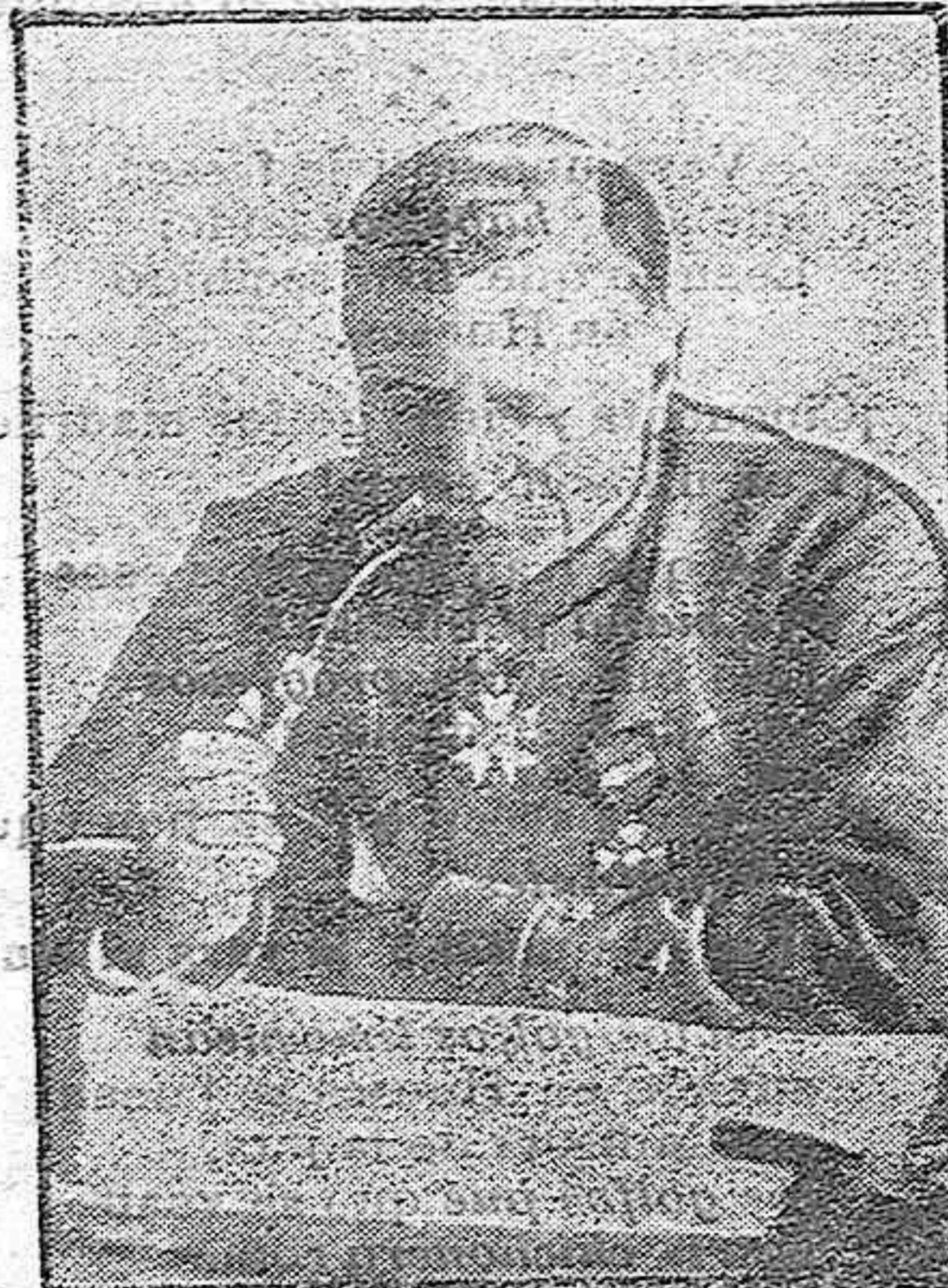
El general Maudhuy

El cuerpo de Ejército cuyo mando sustentaba, acaba de distinguirse al Norte de Verdun, y á él debe el Ejército francés la reconquista de Vauvemont, Vaucheranville, de las obras de Harcourt y Benzouaux, en cuyos triunfos han capturado más de 7.000 prisioneros.