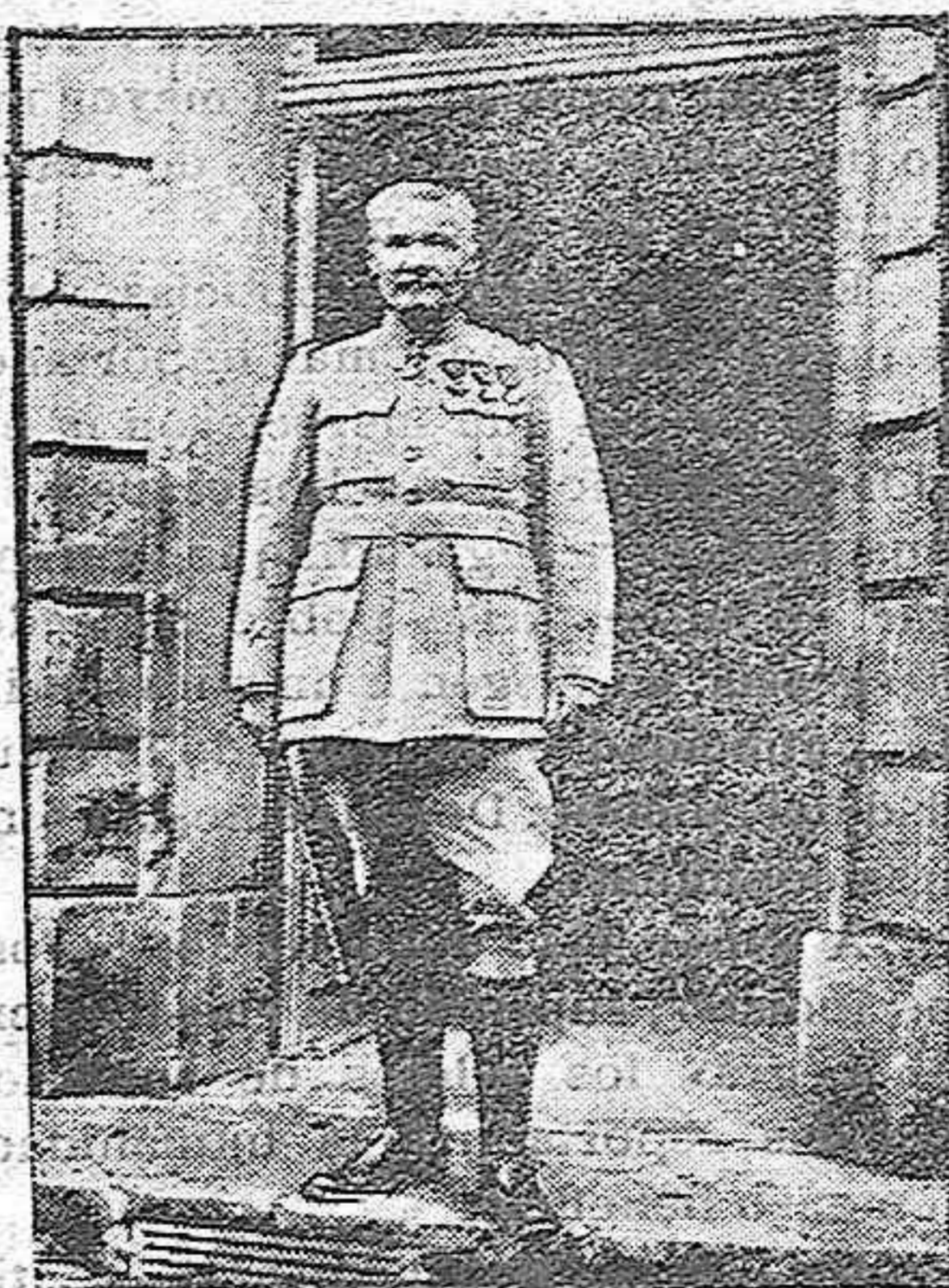
El general Passaga

Portavoz del Ministerio de Provisiones, él es el puntual y perfecto organizador de los transportes militares, así como el aprovisionamiento de la población civil que en tan difíciles circunstancias se desarrolla normalmente, gracias á su constante celo y desinteresado esfuerzo que, en su día, recompensará la Patria.