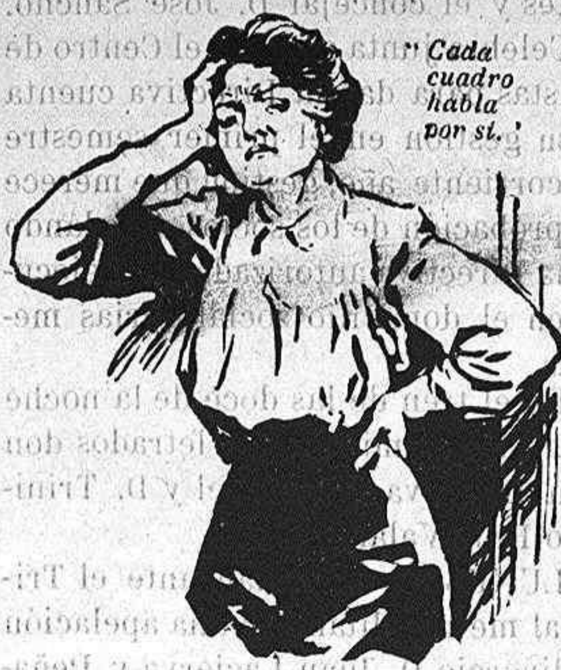
Cada cuadro habla por sí.