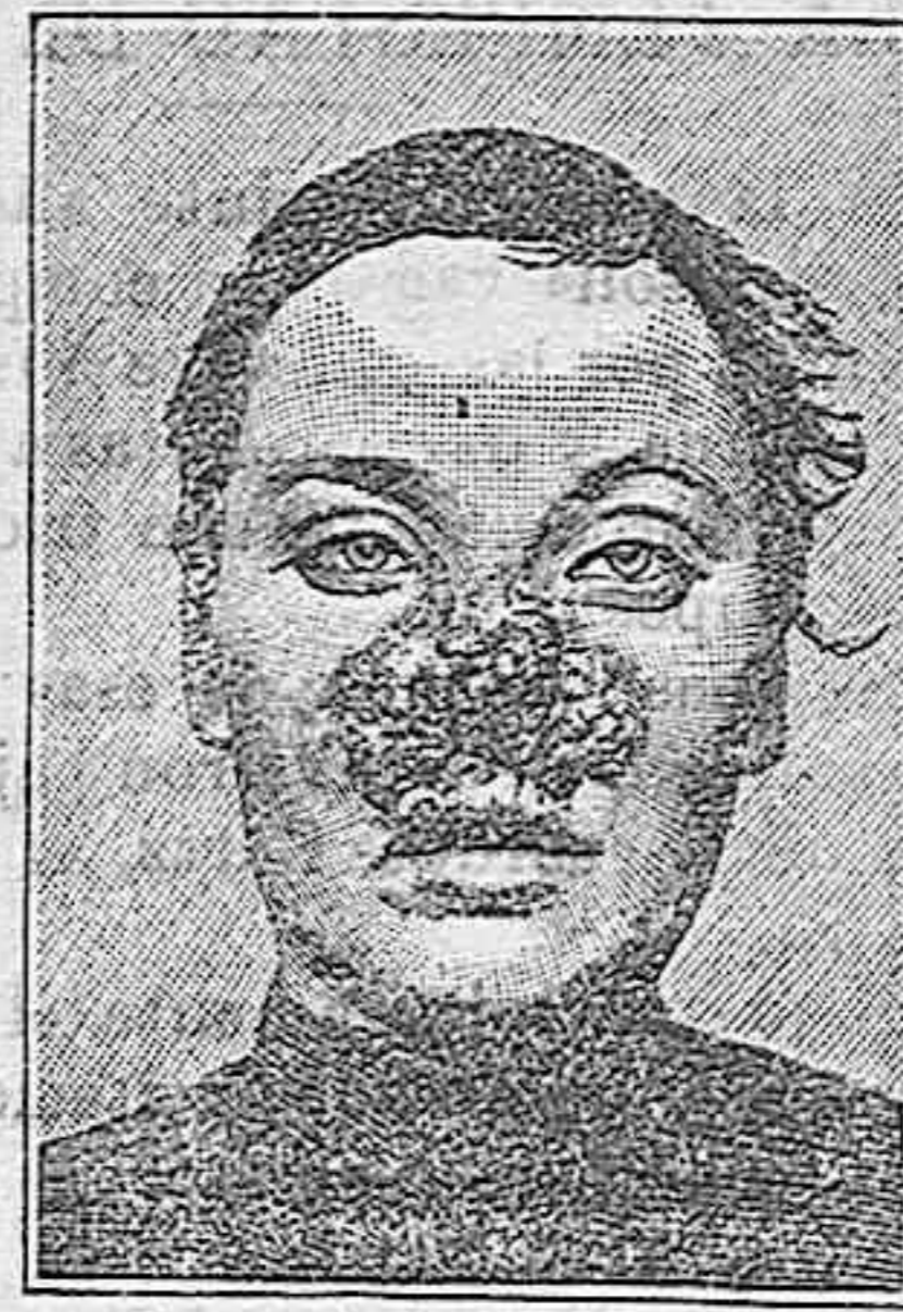
Antes de la curación.