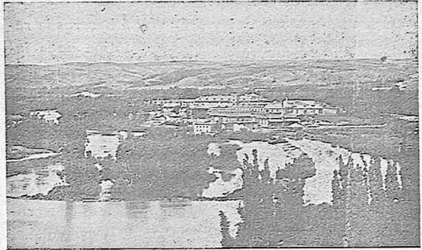
Vista general de la Fábrica de Armas.

res) acaso después de una labor penosa y no ciertamente lírica, de darle vueltas al presupuesto municipal, concertar voluntades, remover obstáculos de todo género, ¿no será una figura tan admirable y digna de poéticas odas como la de un general vencedor en sangrientos combates?